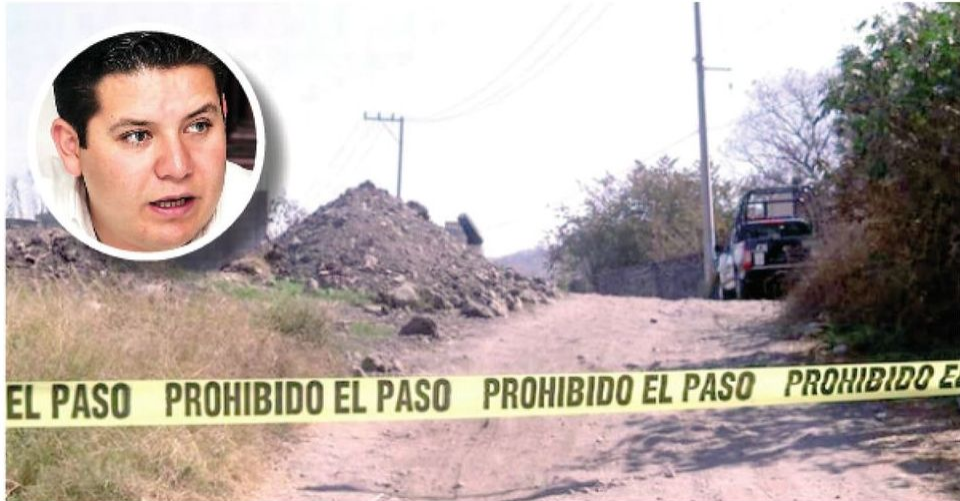
Las denuncias por delitos sexuales han aumentado hasta en un 300 por ciento