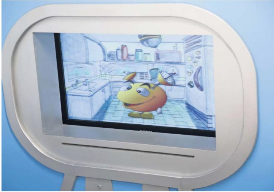
Este personaje de color amarillo, procedente del planeta Antenopolis, es controlado por especialistas y no habla con adultos, por lo que crea confianza en los niños.