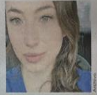
La doctora no presentaba signos de violencia.

La anesthesióloga sería originaria de Chihuahua.