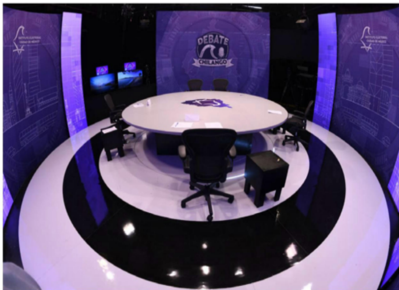
El último debate electoral se realiza a veinte días de la votación, el 2 de junio.

Los aspirantes expondrán sus propuestas sobre "Seguridad y Justicia" y "Planeación del desarrollo inmobiliario urbano"