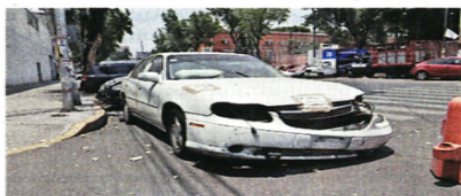
Unidades presentan autopartes que fueron desprendidas.

"Para que en el ámbito de su competencia, lleven a cabo acciones extraordinarias necesarias para desocupar los Depósitos Vehiculares de la Institución, mediante la compactación de los vehículos chatarra que se encuentren en ellos", planteaba. Llevar a cabo licitaciones, invitaciones restringidas, adjudicaciones para subastar, vender o donar los bienes, era una tarea del comité que