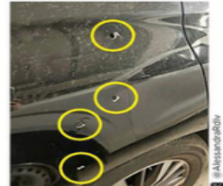
La candidata compartió fotos del vehículo atacado.

Minutos antes, la candidata había realizado un recorrido en la Colonia Peralvillo, próxima al Barrio de Tepito.