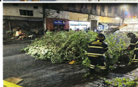
La caída de árboles se registró en al menos seis alcaldías.

a los resultados de los análisis del agua contaminada, con muestras recolectadas en domicilios afectados, explicó. "Es inadmisibles que un Gobierno que tendría que estar cuidándonos, resulta que somos nosotros quienes tenemos que estar cuidándonos de ellos", mencionó.