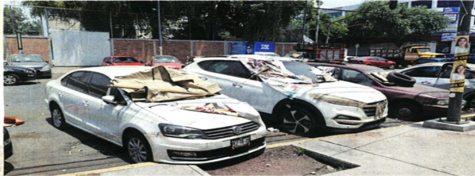
¿CALLE O BODEGA? La Fiscalía coloca las unidades relacionadas con carpetas de investigación en la vía pública.

Alertan los vecinos que calle llega a ser cerrada por exceso de vehículos