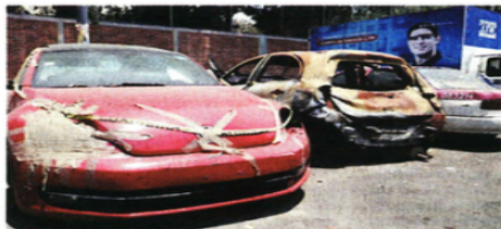
Los autos siniestrados acumulan basura.

El Comité de Destino Final de Bienes Asegurados fue creado con el acuerdo FGJCDMX/40/2022, del 3 de noviembre de 2022, suscrito por la entonces Fiscal Ernestina Godoy.