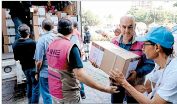
▲ Personal del INE descarga los insumos en Zapopan, Jalisco.