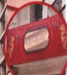
Club Cielo y Tierra, dice en la fachada.

CACHAN TUGURIO SÓLO PA' LA BANDA ASIÁTICA EN PLENO CENTRO HISTÓRICO 2