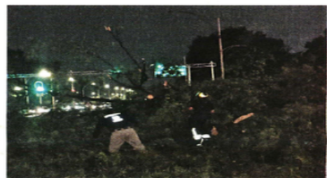
Los cortes fueron reportados después de las 20:30 horas.