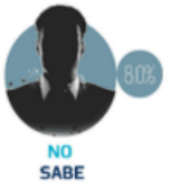
GRÁFICO: ALEJANDRO OYERIDES