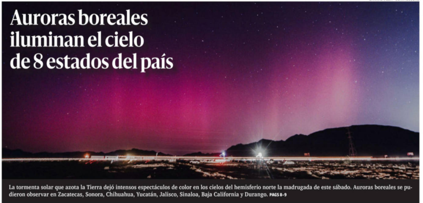
La tormenta solar que azota la Tierra dejó intensos espectáculos de color en los cielos del hemisferio norte la madrugada de este sábado. Auroras boreales se pudieron observar en Zacatecas, Sonora, Chihuahua, Yucatán, Jalisco, Sinaloa, Baja California y Durango. PÁGS 8-9