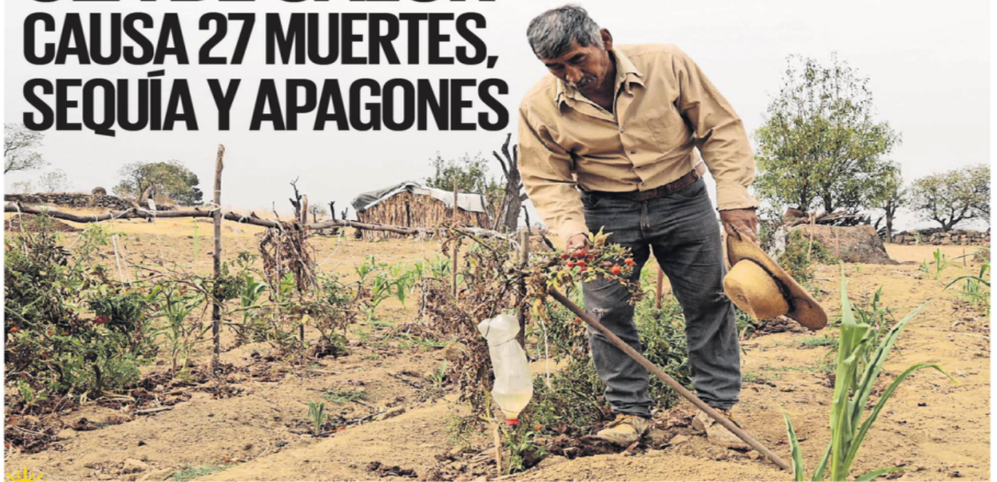
JORGE MEDELLÍN, EL UNIVERSAL

Trabajadores del campo en la capital del país han optado por vender sus tierras ante el árido panorama.