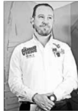
▲ A tres semanas de las elecciones, los tres abanderados apostarán por machacar los puntos