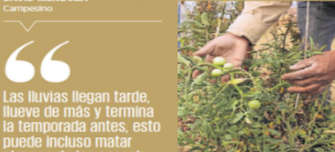
Campesinos optan por especies que soporten condiciones extremas.

del Gobierno de la Ciudad de México, apuntó que una de las principales causas de la falta de lluvias en la capital y el aumento en la temperatura es el fenómeno El Niño.