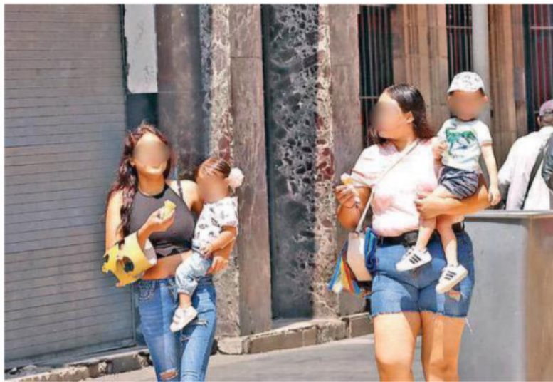
El consumo adecuado de agua no solo fortalece el sistema inmunológico, sino que también mejora la concentración y el rendimiento cognitivo, señalan expertos

Para los niños de 4 a 8 años, la recomendación es de 1.6 litros, aproximadamente 6-7 vasos. A partir de los 9 años, se sugiere un consumo de 1.9 a 2.1 litros, y desde los 14 años, la cantidad recomendada es de 2.5 litros diarios, lo que serían aproximadamente diez vasos de agua.