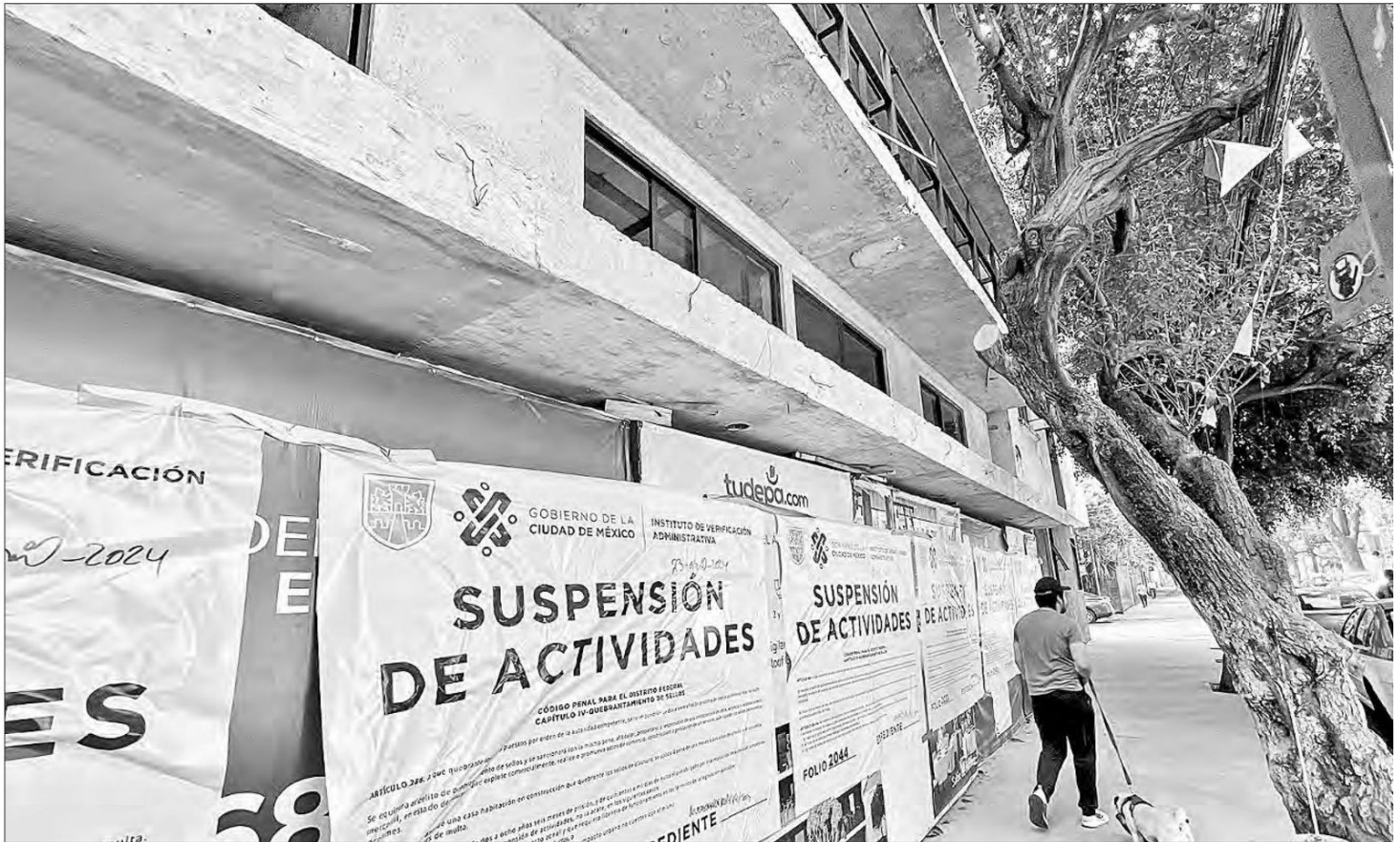
▲ Las dependencias capitalinas encargadas de supervisar los complejos habitacionales han detectado diversas irregularidades, sobre todo en la alcaldía Benito Juárez.