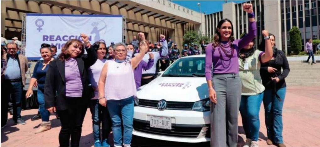
Tiene como objetivo proteger y garantizar una vida libre violencia para todas las mujeres que habitan y transitan en la alcaldía Cuauhtémoc a través de acciones con perspectiva de género.