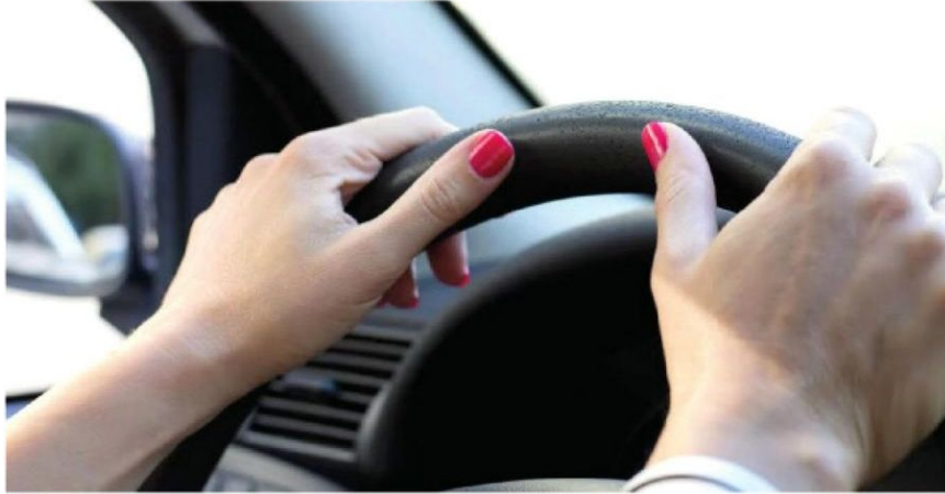
Los casos engloban violencia física y verbal en la vía pública