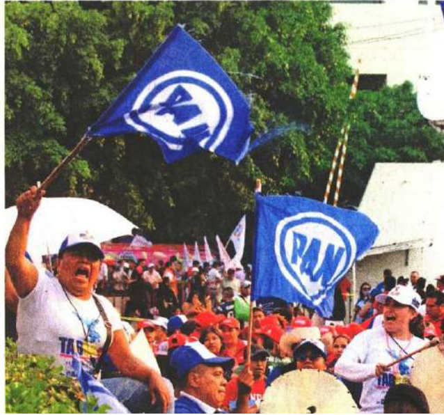
Los seguidores de Santiago Taboada se dividieron en dos grupos para cubrir todos los frentes ante los contingentes morenistas.