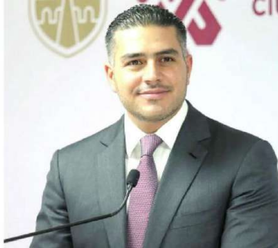
Forma parte del Consejo Asesor de la morenista