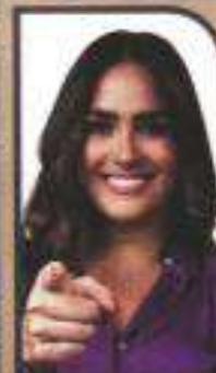
La candidata del PRI-PAN-PRD asegura que más de seis veces dispararon contra el vehículo.

“Mi vida no podrá ser igual, pero sé que aquí jamás nos vamos a rendir. Esto se gana con votos, no con miedo ni amenazas, ni mucho menos con odio”.