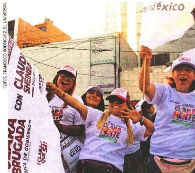
Los simpatizantes de la exalcaldesa de Iztapalapa fueron los más numerosos, fiesteros y escandalosos a las puertas de MVS.

Adentro, los abanderados también recibieron apoyo. Con Brugada Molina estuvieron los exjefes de gobierno, Marcelo Ebrard y Alejandro Encinas, así como los candidatos al Senado, Omar García Harfuch y Ernestina Godoy. En el caso de Taboada Cortina llegaron los presidentes nacionales del PAN, Marko Cortés Mendoza, y del PRD, Jesús Zambrano Grijalva. ●