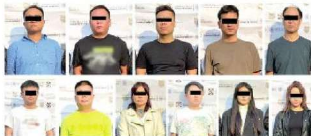
• Los extranjeros delinquant en la CDMX

dosis de droga fueron encontradas en el inmueble cateado