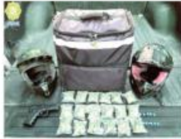
Ajuste de cuentas entre narcoconmenudistas