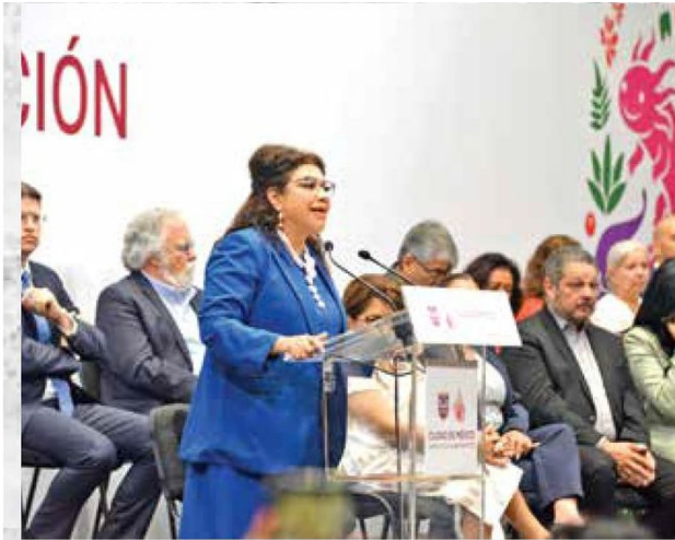
La jefa de Gobierno, Clara Brugada, anunció una iniciativa para cambiar las reglas que permitan las corridas de toros.