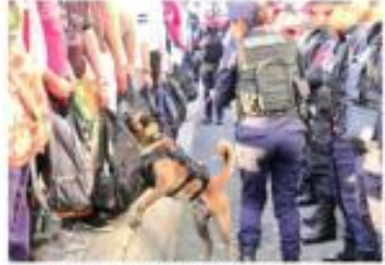
Los canes inhibieron a los delincuentes