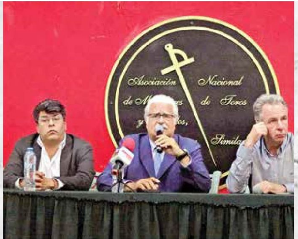
Organizaciones de matadores, empresarios taurinos y ganaderos señalaron que la propuesta no tiene consenso.