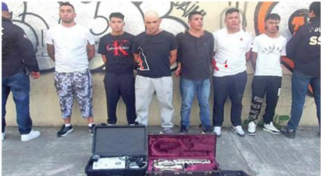
Ya no seguirán delinquiendo

El robo del que se les imputa sucedió cuando los seis ingresaron a una vivienda en Álvaro Obregón, amenazando al residente con un cuchillo y despojándolos de objetos de valor, incluyendo una camioneta.