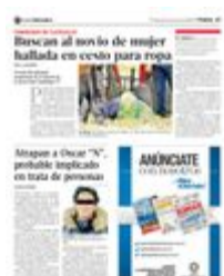
El cadáver fue hallado envuelto en cobijas y un cesto para ropa en las jardineras de la unidad habitacional