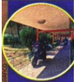
JOSÉ ESTEBAN EL GRÁFICO