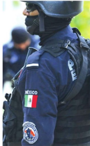
Destacaron los resultados

El legislador subrayó que los resultados obtenidos durante la pasada administración son contundentes: el secuestro se redujo en un 95% y el robo de vehículo con violencia en un 70.