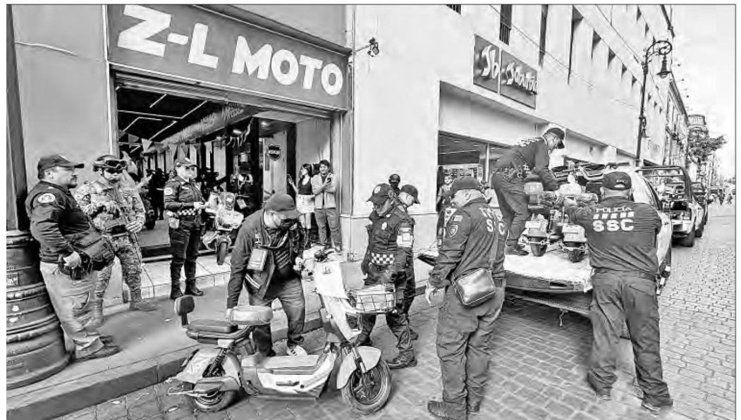
▼ Personal de la Secretaría de Administración y Finanzas, con apoyo de la SSC capitalina y la Secretaría de Marina, realizó un operativo para decomisar vehículos eléctricos de origen chino.

Con el propósito de garantizar la seguridad y prevención de accidentes, se instaló el punto de revisión en avenida Insurgentes Sur a la altura de Villa Olímpica, en la colonia Peña Pobre.