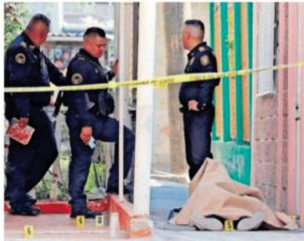
Los policías de la SSC acordonaron el afanador desde la calle José Mariano Cosme hasta Congreso de Chilpancingo Norte