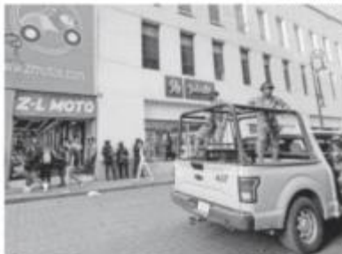
El operativo se realizó con apoyo de la Marina