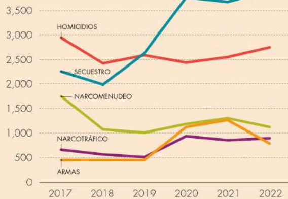
Mujeres privadas de la libertad en México | POR DELITO (2017-2022)

Existe un aumento en el número de mujeres en cárceles por diversos delitos relacionados con el crimen organizado.