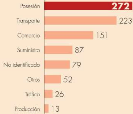
Mujeres privadas de la libertad | NARCOTRÁFICO POR CATEGORÍA 2022