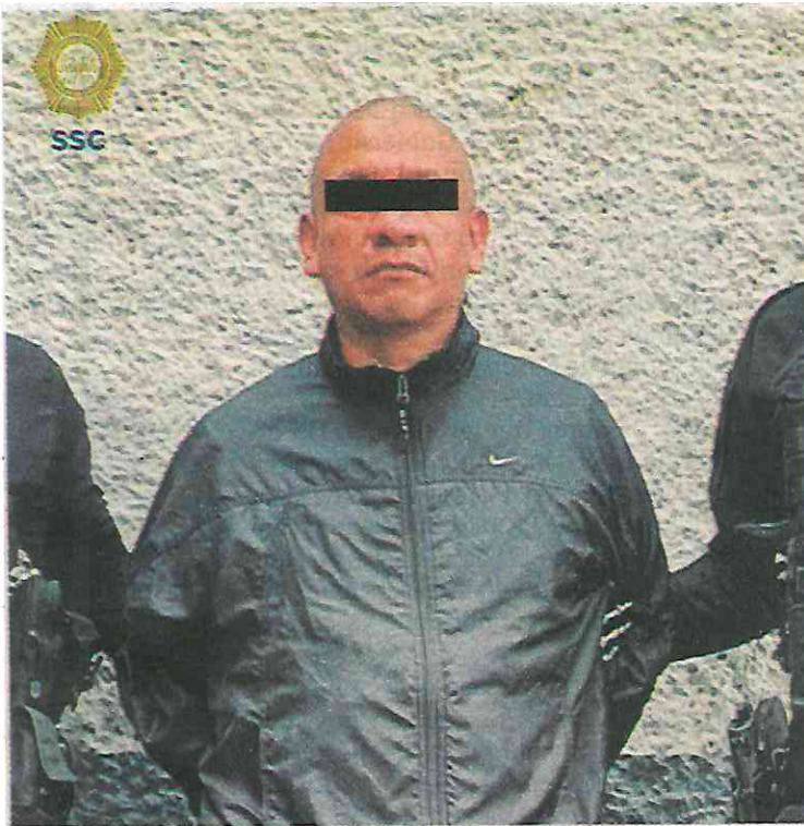
El maleante amenazaba con causar daño a la integridad física y patrimonial de los comerciantes para extorsionarlos.

las Lomas, en la alcaldía Miguel Hidalgo, donde tomaron conocimiento y coadyuvaron en el apoyo prehospitario de tres personas que resultaron lesionadas, luego que el conductor de un vehículo perdiera el control y se impactara en un árbol.