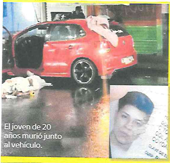
El joven de 20 años murió junto al vehículo.