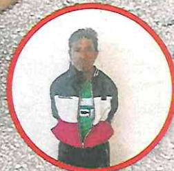
Policías le hallaron el picahielo al agresor.