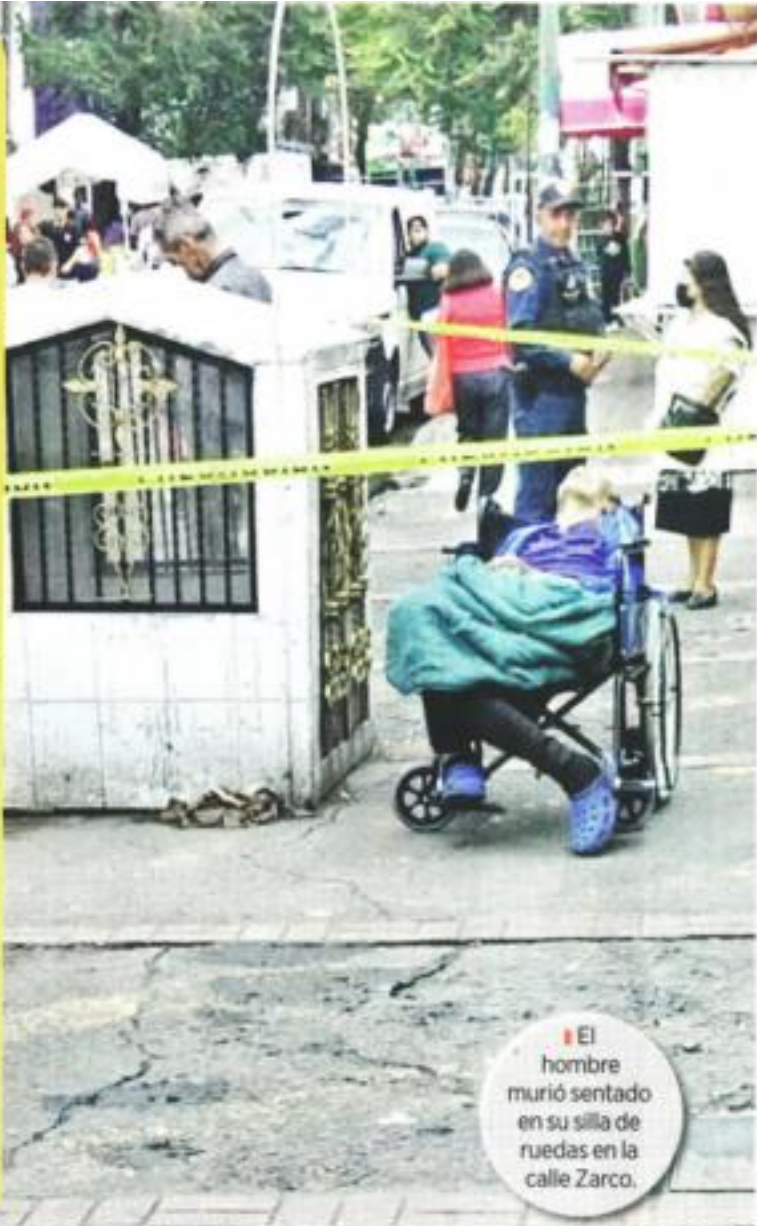
El hombre murió sentado en su silla de ruedas en la calle Zarco.

La víctima no fue identificada en el lugar.