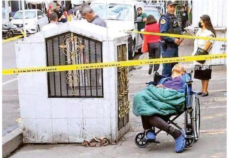
El hombre de entre 50 y 60 años quedó junto a un nicho en Zarco y Mosqueta

Al hombre le costaba trabajo respirar, por lo que se llamó de inmediato a los paramédicos