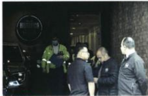
ESTALLIDO. El accidente ocurrió en el Hotel Histórico Central, donde uno de los trabajadores sufrió una crisis nerviosa.