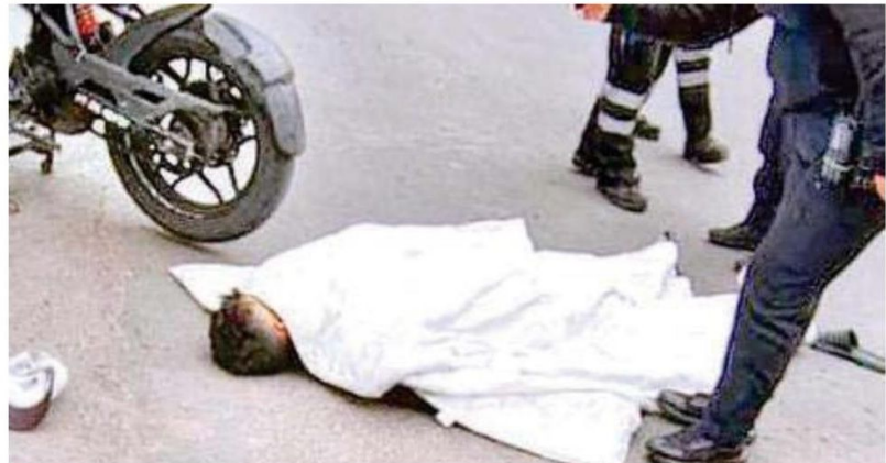
El ahora occiso quedó sobre la cinta asfáltica sin vida, con una motocicleta a un costado de él

La motocicleta fue subida a una camioneta de la SSC para llevarla ante el Ministerio Público.