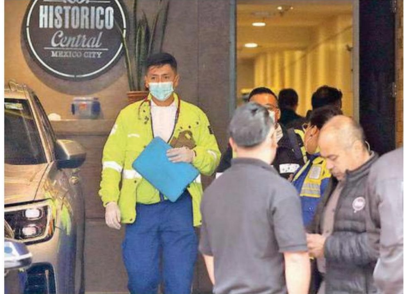
Autoridades de PC informaron que dentro de la cocina solo explotó la olla, la cual ensució las paredes y no hubo mayor daño

Posteriormente el personal del hotel continuó como si nada hubiera sucedido y las autoridades y paramédicos se retiraron del lugar.