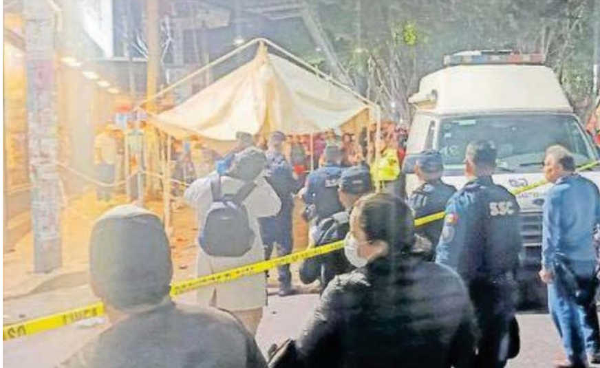
Los hechos se registraron en la Avenida Manuel Cañas, esquina con Villa Angel, alcaldía Iztapalapa, afuera de una panadería / JOSÉ MELTON