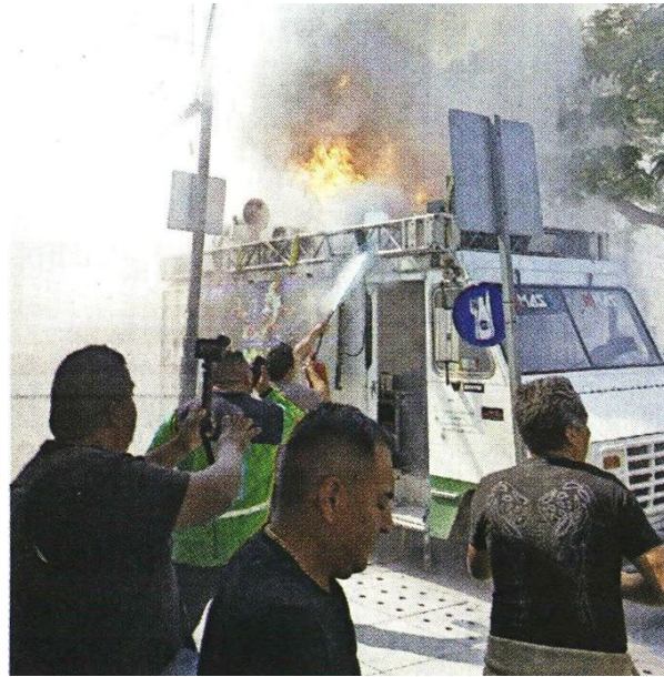
Con extintos lograron sofocar las llamas del camión que llevaba el sonido en una peregrinación.

“El ordenamiento del espacio público y el retiro de ambulantes de la vía pública que comenzaron el lunes, permitió las condiciones de movilidad y operatividad para sofocar el incendio el cual terminó en saldo blanco, pues no hubo lesionados de gravedad”, indicó la Alcaldía.