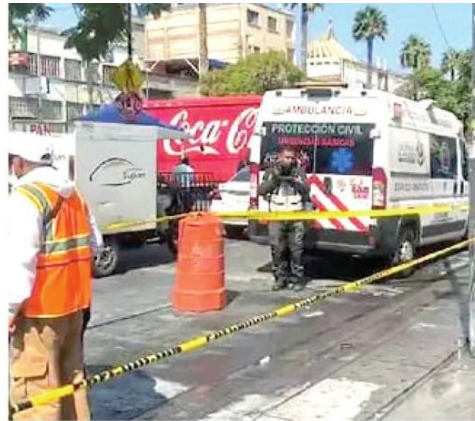
Rondó la tragedia

Efectivos de la Secretaría de Seguridad Ciudadana (SSC) acompañaron a los peregrinos hasta su arribo a la Basílica de Guadalupe.