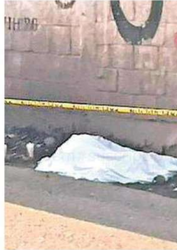
El conductor de una camioneta los atropelló y arrojó contra la barda que estaba detrás de ellos

Hasta el sitio acordonado y resguardado por los uniformados llegaron familiares de la víctima que lloraban desconsolados mientras se llevaban a cabo las diligencias por parte de personal de la Fiscalía General de Justicia FGI de la Ciudad de México quienes hicieron el levantamiento del cadáver y lo trasladaron al anfiteatro correspondiente donde continuarán las investigaciones.