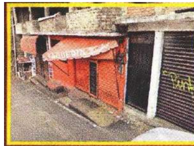
La dueña de la taquería identificó al maleante.

TRAÍA EL FILERO. Minutos más tarde, en la calle Aldama de la misma colonia, oficiales interceptaron a uno de los sospechosos, a quien, en la revisión preventiva realizada conforme a los protocolos, le hallaron un cuchillo con el que picó al joven.