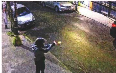
En el video se observa a un sujeto que usa casco disparar contra la camioneta de la candidata.