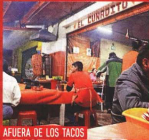
AFUERA DE LOS TACOS