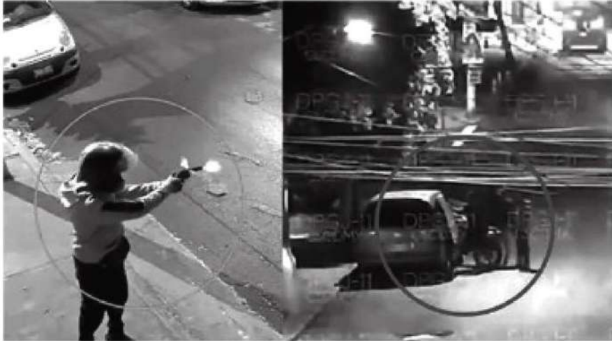
Así fue captado el ataque armado en video