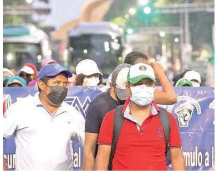
El grupo de manifestantes logró derribar las vallas y entrar por Bucareli, pero policías ya los tenían encapsulados