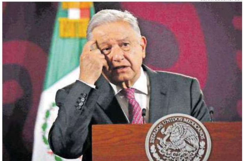
El presidente garantiza luz eléctrica para el día de las elecciones.

El Presidente insiste que es necesario que a los integrantes del Poder Judicial sean elegidos por parte de la ciudadanía