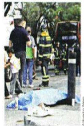
El accidente se registró en la Colonia Peralvillo.