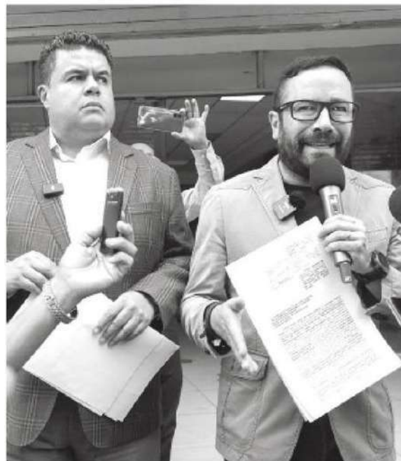
Revelan uso de vehículos oficiales