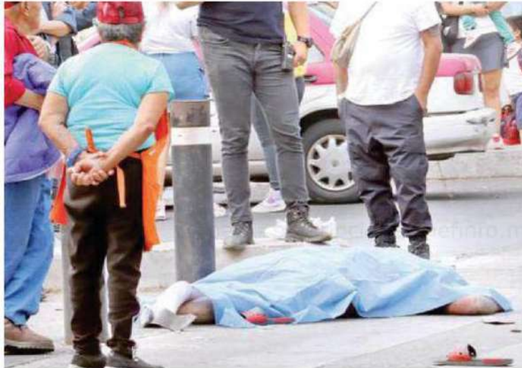
Servicios periciales arribaron al lugar para realizar las diligencias necesarias y el levantamiento del cuerpo para llevarlo al anfiteatro