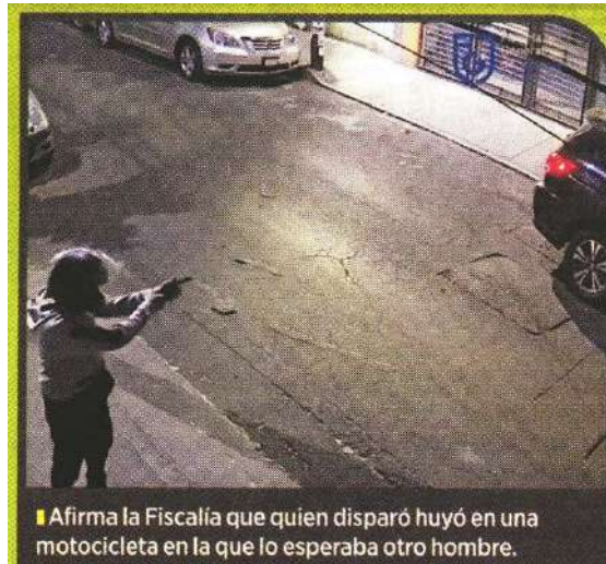
■ Afirma la Fiscalía que quien disparó huyó en una motocicleta en la que lo esperaba otro hombre.