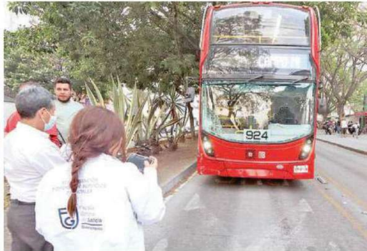
Autoridades investigan si el motorista se pasó el alto o el Metrobús iba a exceso de velocidad