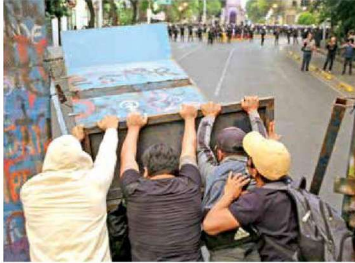
Momento en que los estudiantes tiran una de las barricadas en las inmediaciones de la Secretaría de Gobernación.