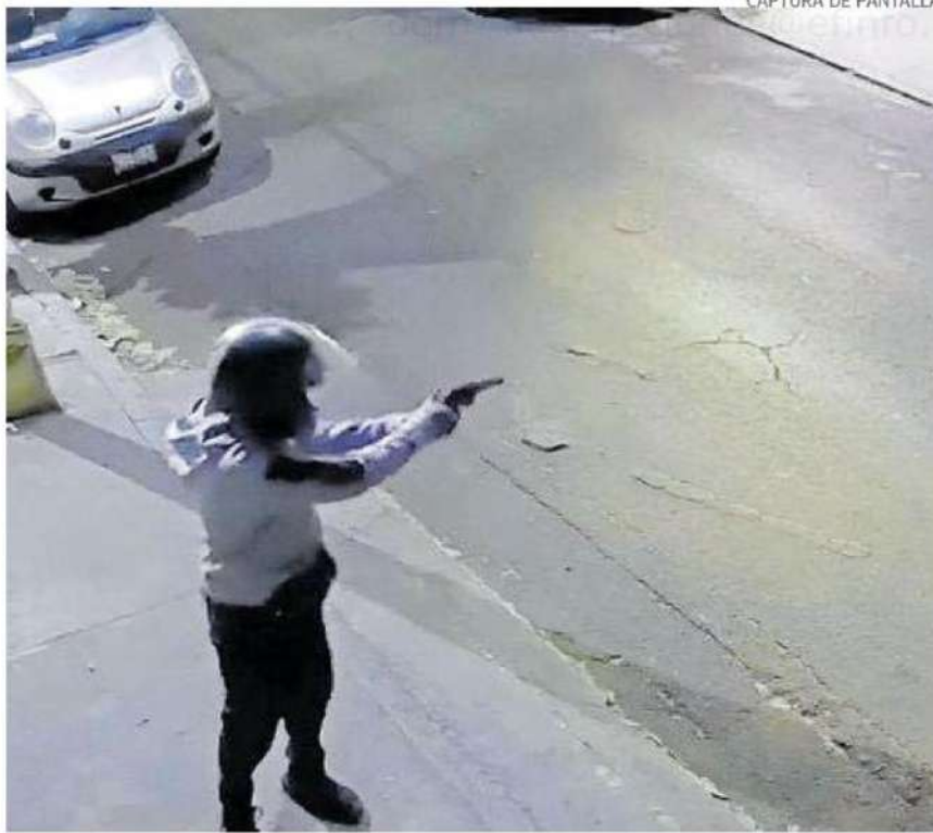
Así fue el tiroteo contra la camioneta.