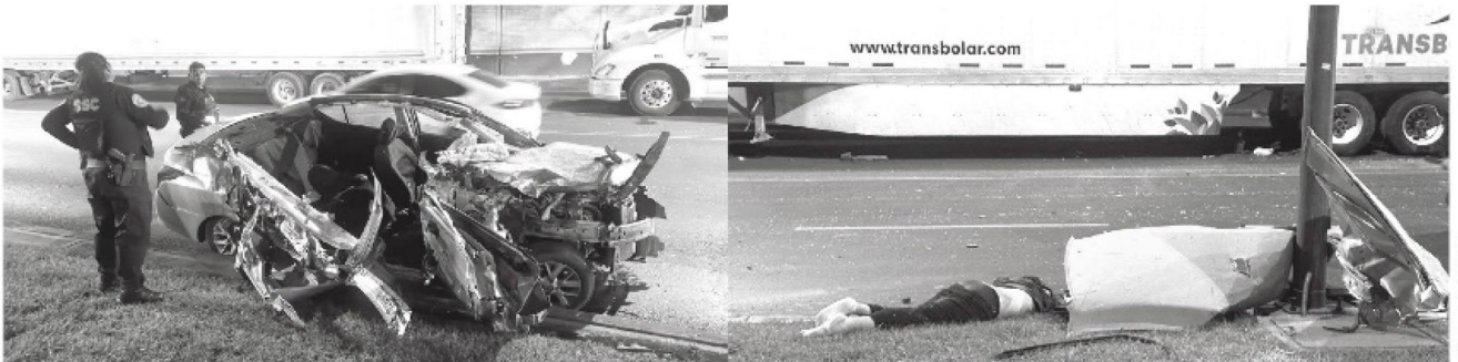
Salió disparado por el parabrisas