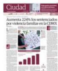
PROTESTA en la ciudad en contra de la violencia familiar, en noviembre de 2021.