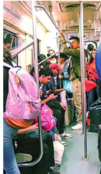
El factor es la distracción

· El director del Metro anunció un despliegue de 5,800 elementos de seguridad en estaciones clave