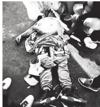
Le metieron 10 balazos

En el lugar del ataque, algunos testigos dijeron que, hace unos meses, el occiso fue capturado con drogas y había recibido amenazas para que ya no vendiera en ese lugar, lo que hace suponer que fue asesinado por una venganza entre narcomenudistas.