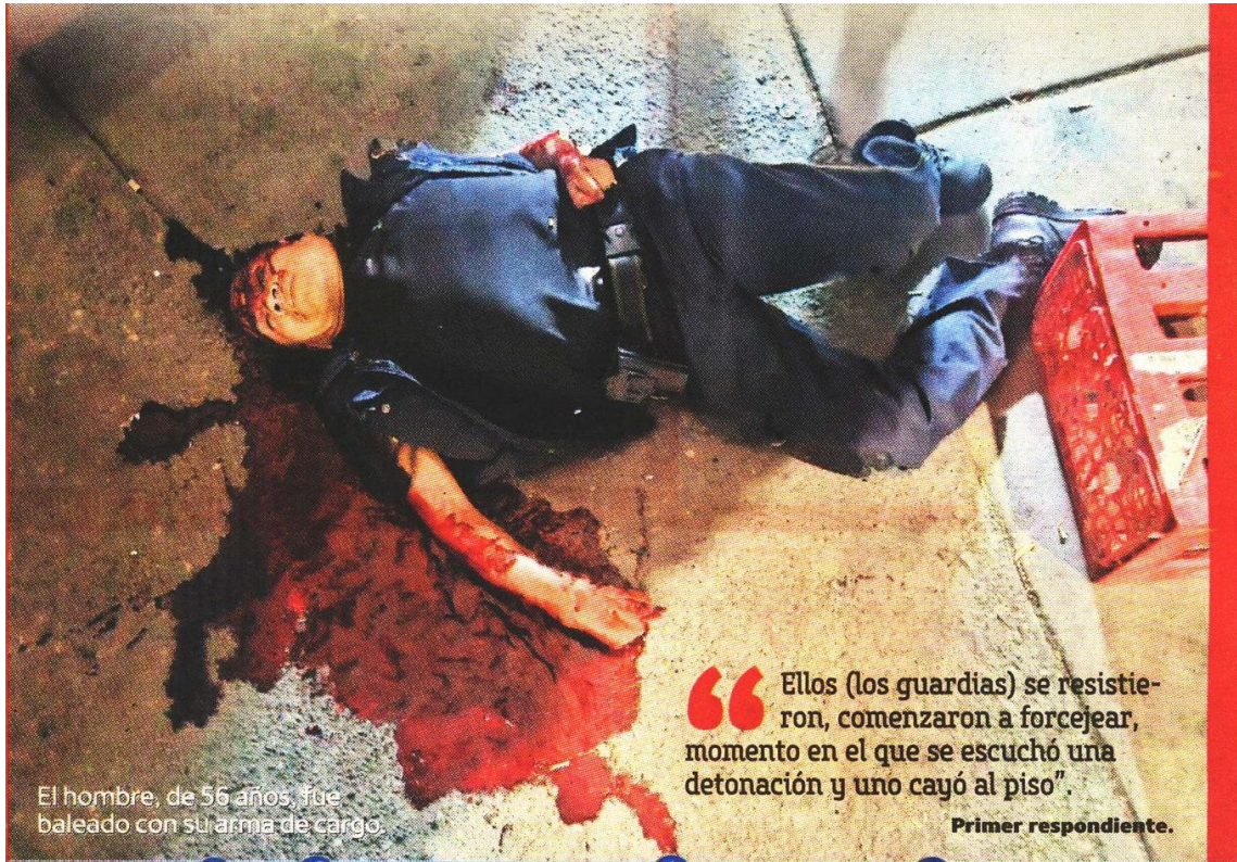
El hombre, de 56 años, fue baleado con su arma de cargo.

“ Ellos (los guardias) se resistieron, comenzaron a forcejear, momento en el que se escuchó una detonación y uno cayó al piso”.