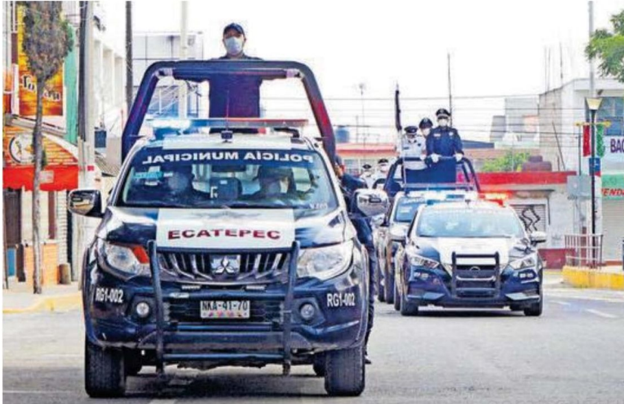
Diputados del Edomex solicitaron se refuercen los operativos de prevención al delito, tanto en centros comerciales como en el transporte público por El Buen Fin