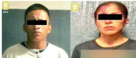
Atraparon a los homicidas

El detenido de 24 años cuenta con tres ingresos al Sistema Penitenciario, uno por Despojo y 2 por Robo agravado, en el año 2024