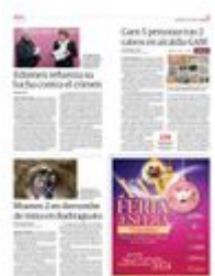
EN EL LUGAR se aseguraron armas, cartuchos, droga y teléfonos celulares, ayer.