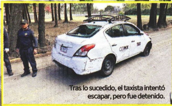
Tras lo sucedido, el taxista intentó escapar, pero fue detenido.

Viernes 15 de noviembre de 2024 EL GRÁFICO