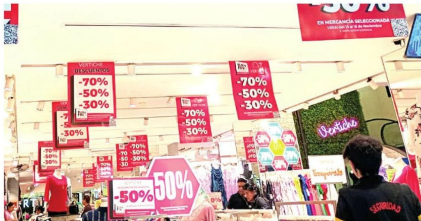
Serán cuatro días en los que se llevará a cabo el evento comercial