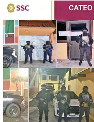
CATEO. La FGJ y SSC realizaron dos operativos simultáneos; cinco personas fueron aprehendidas.

Los detenidos, junto con lo asegurado, fueron presentados ante el agente del Ministerio Público, quien definirá su situación jurídica. /RODRIGO CEREZO