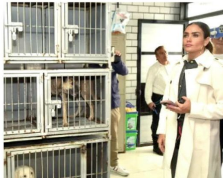
Condiciones del lugar los ponen en riesgo