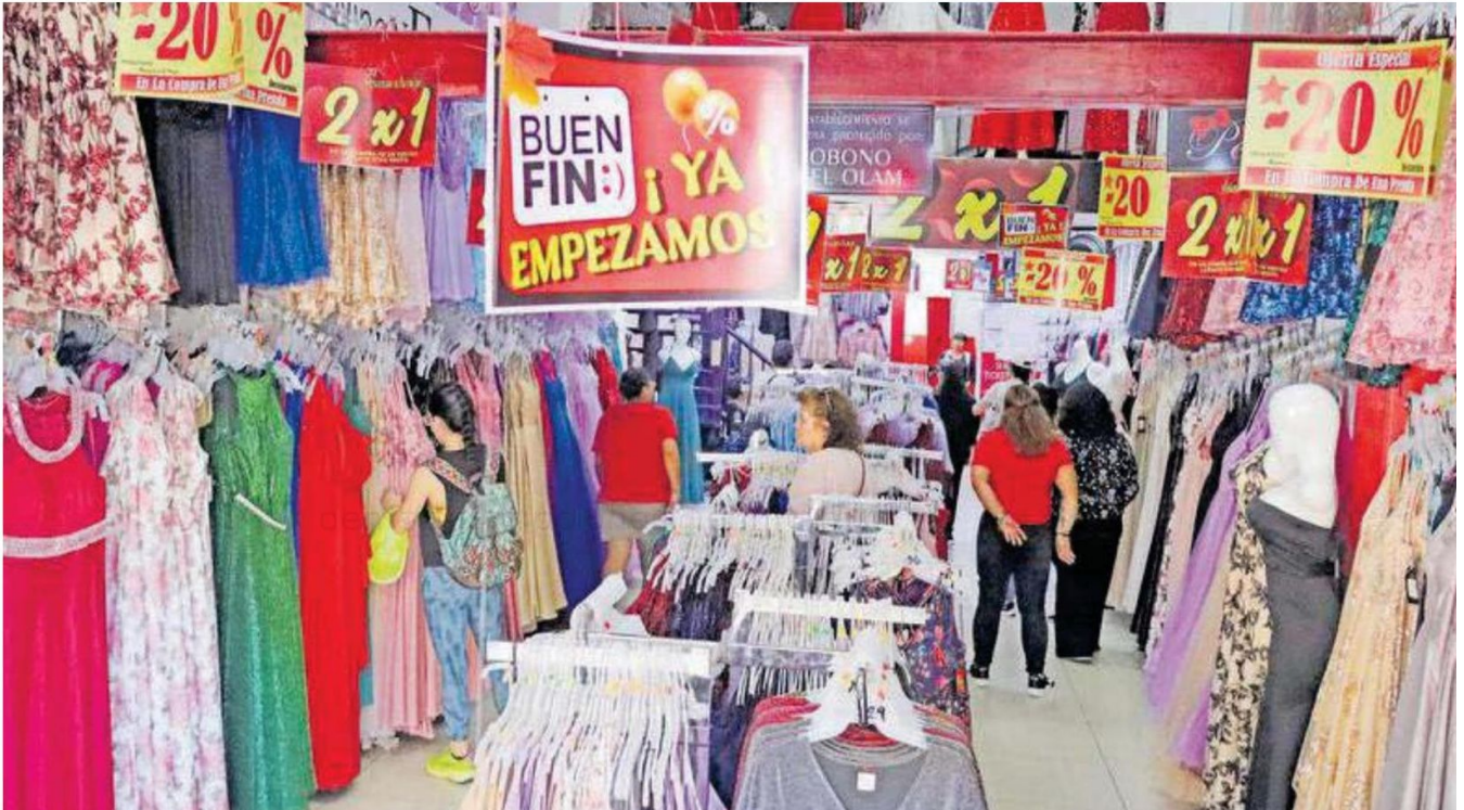
El pequeño comercio organizado estima que, pese al incremento de precios registrado en los últimos meses y que afecta el costo final de los productos, en El Buen Fin los consumidores realizarán sus compras con confianza