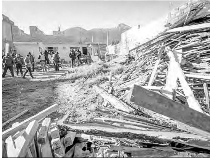
◀ Autoridades del gobierno de la ciudad y federales clausuraron un predio donde se almacenaba y transformaba materia prima forestal de manera ilegal, en Santo Tomás Ajusco, en la alcaldía Tlalpan.

verdes para proteger los recursos naturales de la ciudad, en un trabajo coordinado con las instancias federales y de las entidades vecinas.