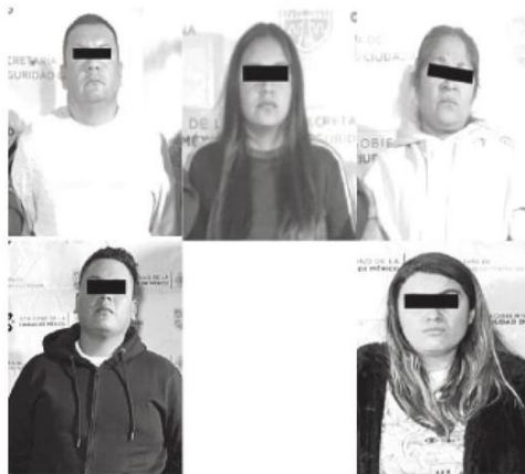
Les cayeron en su guarida

Las casas que funcionaban como bodegas de almacenamiento fueron selladas y custodiadas por policías.