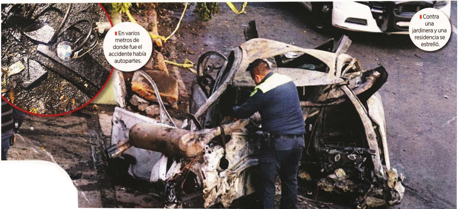
■ En varios metros de donde fue el accidente había autopartes.