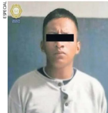
En un dispositivo de búsqueda fue detenido el implicado.

La Secretaría de Seguridad Ciudadana sigue investigando los hechos y busca esclarecer los motivos detrás de la agresión mortal. ●