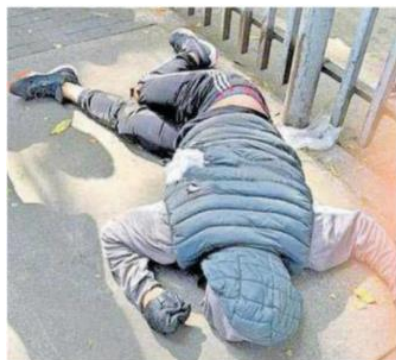
El conductor de la unidad huyó del sitio, sin que hasta el momento se conozca su paradero