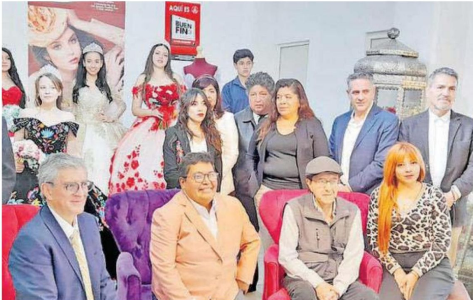
Para comerciantes de vestidos de celebraciones y bodas del CH, El Buen Fin ha sido la oportunidad de organizar a su gremio para ofrecer rebajas del 5 al 50 por ciento