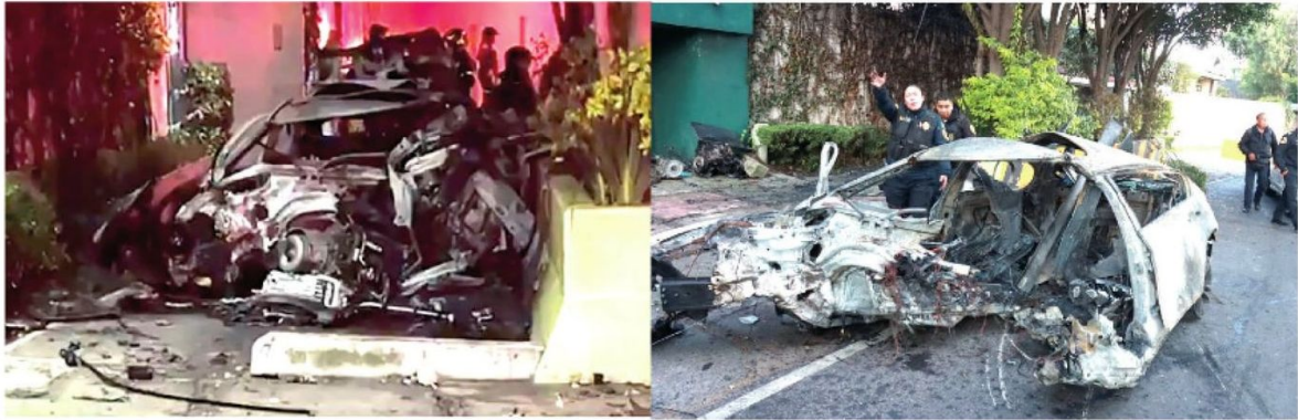
El vehículo terminó hecho chatarra

Vecinos ya habían colocado el muro de contención debido a que varios vehículos circulaban a exceso de velocidad.