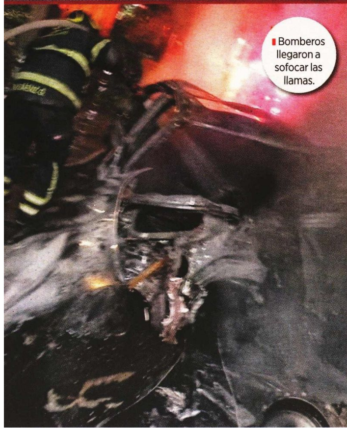
■ Bomberos llegaron a sofocar las llamas.