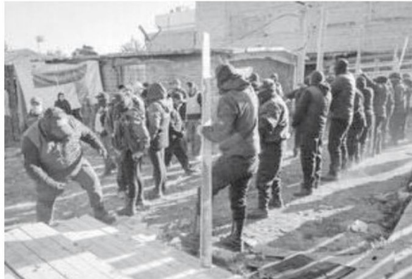
Este es parte del material que aseguró la autoridad