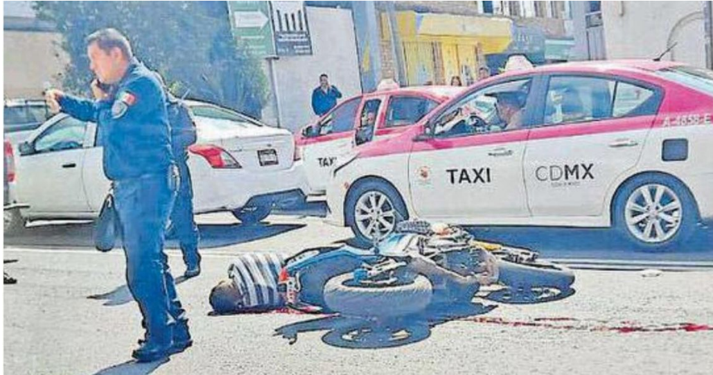
El conductor del taxi y presunto responsable fue detenido y quedó a disposición de las autoridades ministeriales