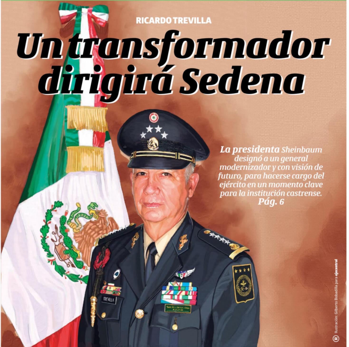
Ilustración: Gilberto Bobadilla para ejeCentral

La presidenta Sheinbaum designó a un general modernizador y con visión de futuro, para hacerse cargo del ejército en un momento clave para la institución castrense. Pág. 6