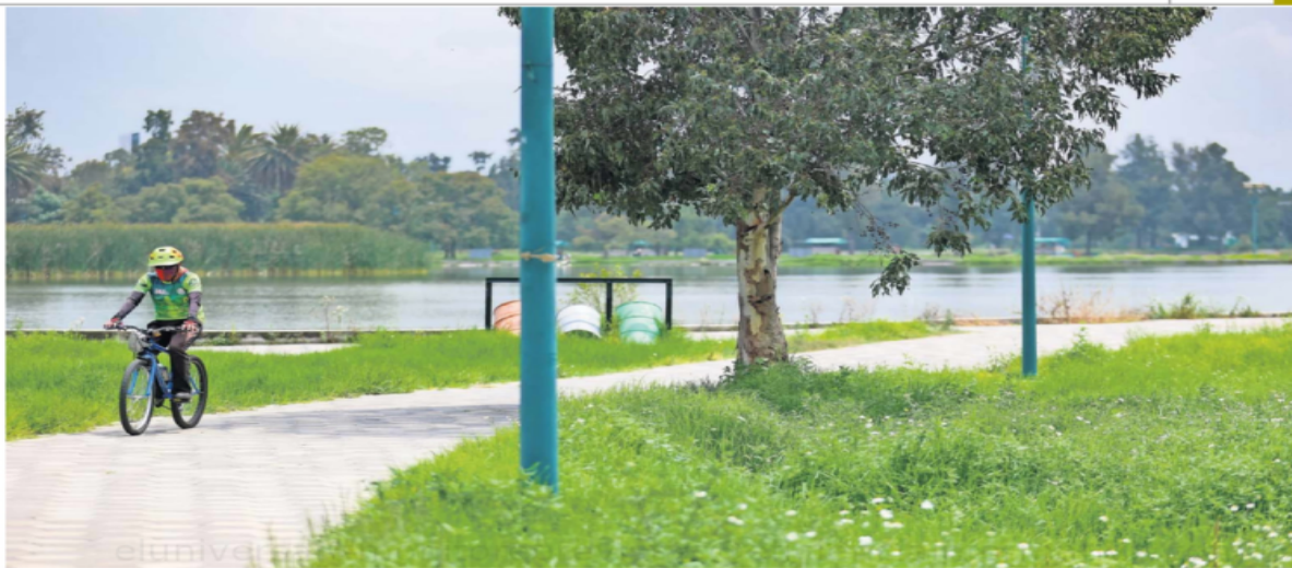
El Bosque de San Juan de Aragón, ubicado en la alcaldía Gustavo A. Madero, es uno de los 17 parques rehabilitados en lo que va de la actual administración.

Texto: FRIDA SÁNCHEZ —metropoli@eluniversal.com.mx