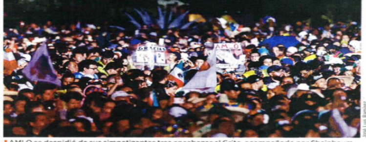
AMLO se despidió de sus simpatizantes tras encabezar el Grito, acompañado por Sheinbaum.