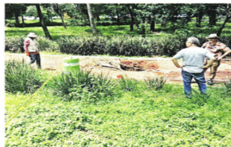
CONTRASTE. Los deportistas urgen a que se cubra el hoyo y los expertos quieren descartar que existan cavernas.