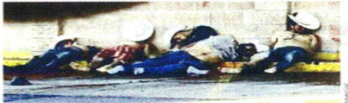
Los cuerpos fueron abandonados con un sombrero.