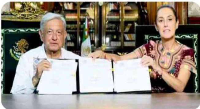
López Obrador promulga la reforma al Poder Judicial, con Sheinbaum COMO TESTIGO

AMLO FIRMA Y PUBLICA la reforma judicial , PESE A ORDEN DE JUEZ