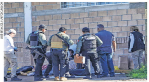
El hecho más sangriento ocurrió en la carretera México-Nogales, donde se hallaron los cuerpos de cinco hombres con las manos atadas a la espalda.