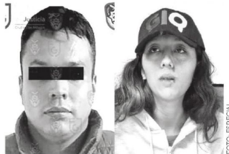
La pareja ya está tras las rejas

En México, las penas por el delito de homicidio detallan que los asesinos recibirán de 30 a 60 años de cárcel; sin embargo, si la víctima es un menor de edad, la pena podría aumentar hasta un tercio.