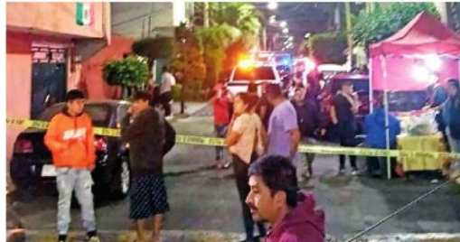
El hecho causó consternación

Agentes de la Policía de Investigación llevan a cabo las indagatorias correspondientes.