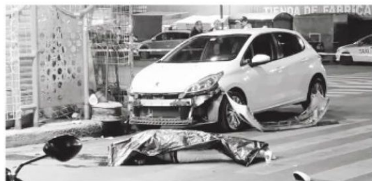
Se estampó de lleno

El motociclista fallecido no llevaba casco de protección.