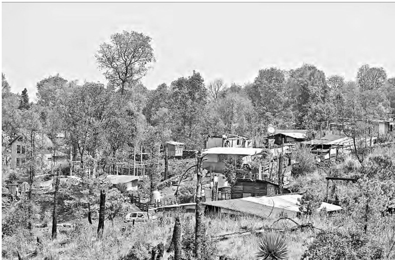
▲ En los suelos de conservación está prohibida la construcción de viviendas, pero grupos de delincuentes se adueñan de esas tierras.