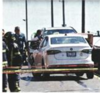
El choque múltiple se registró en el puente de José María Castorena, en la Alcaldía Cuajimalpa, y también dejó un herido.