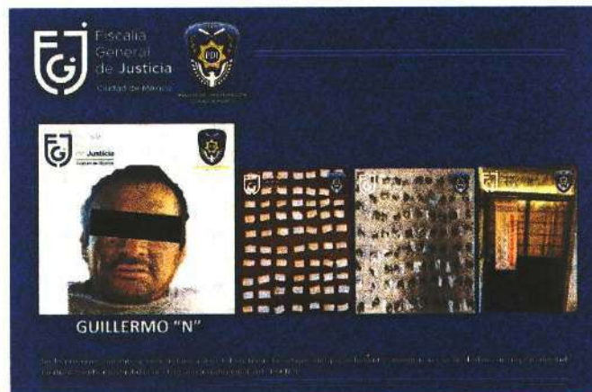
El cateo se realizó en seguimiento a una carpeta de investigación por la posible comisión de delitos contra la salud, señaló la fiscalía.

Al llevar a cabo la diligencia, los agentes investigadores de la Fiscalía de Investigación del Delito de Narcomenudeo, de la Coordinación General de Investigación de Delitos de Alto Impacto encontraron dosis de sustancias con características similares a narcóticos. En el inmueble se encontraba un hombre, que fue detenido y trasladado a las instalaciones de dicha fiscalía, a fin de continuar las indagatorias correspondientes. ●