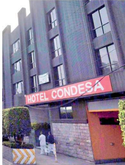
Aquí ocurrió el bestial feminicidio