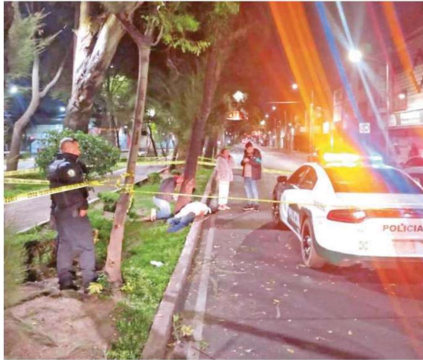
Sobre el camellón quedó el cuerpo de una motociclista que perdió la vida por conducir con exceso de velocidad