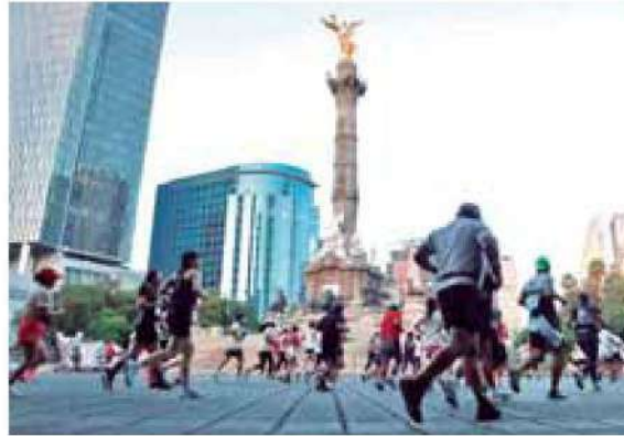
Preparación. Los corredores se alistan para el Maratón. /@21KCDMX