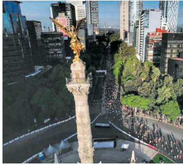
Esta es la quinta carrera para completar el bloque 2019-2024