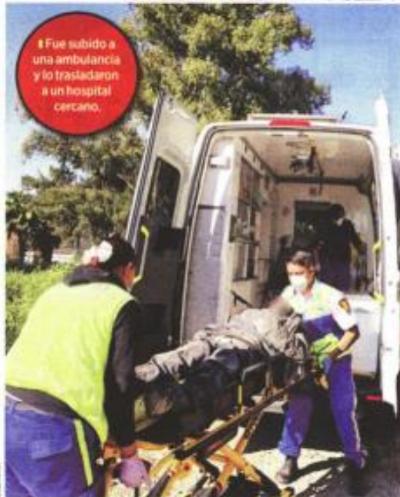
Fue subido a una ambulancia y lo trasladaron a un hospital cercano.