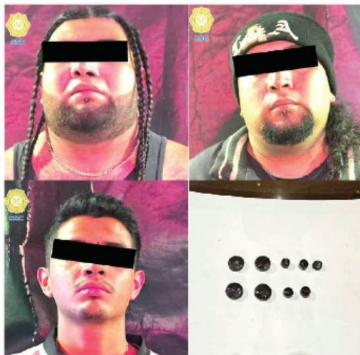
Les cayó la voladora

Artefactos explosivos tenían en su poder los detenidos