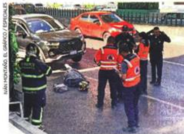
IVÁN MONTEAÑO. EL GRÁFICO / ESPECIALES