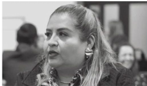
· Subrayó la importancia de obra pública