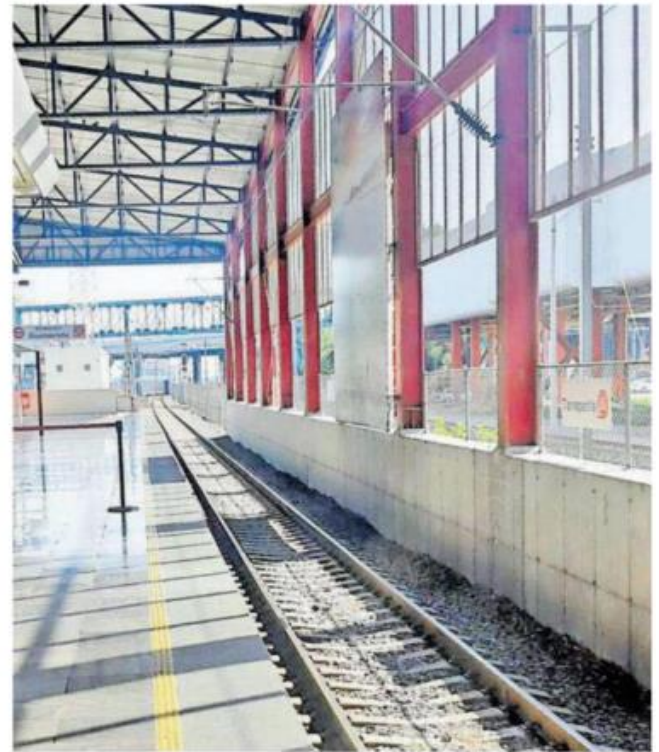
Los hechos se registraron en la estación del Tren Suburbano, ubicado en Poiniente 128 y Ceylán, colonia Industrial Vallejo /FOTO: ILUSTRATIVA

Posteriormente llegaron servicios periciales de la Fiscalía General de Justicia de la Ciudad de México para realizar las diligencias y el levantamiento del cuerpo.