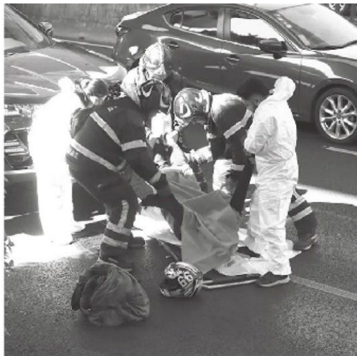
• Todo se debió a un incidente vial

Las dos unidades fueron arrastradas por una grúa al depósito vehicular