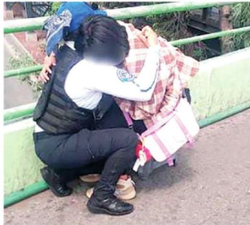
Al final no cumplió su cometido

Una mujer policía sujetó a la suicida antes de que se aventara