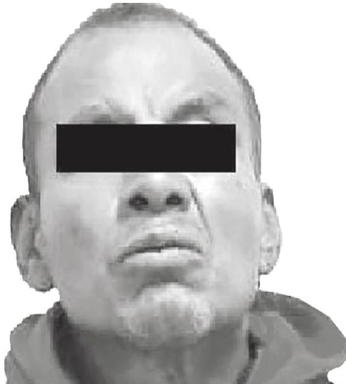
Las cámaras de seguridad lo delataron

Horas después de que hallaron el cuerpo, el presunto asesino fue capturado