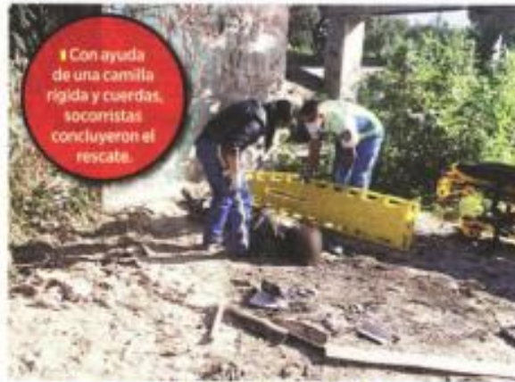
Con ayuda de una camilla rígida y cuerdas, socorristas concluyeron el rescate.

"Acudieron paramédicos del ERUM, quienes con todos los cuidados descendieron, lo estabilizaron y (lo diagnosticaron) con insuficiencia respiratoria por probable intoxicación", explicó la Policía.