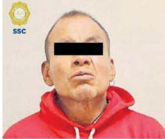
El imputado quedó a disposición de las autoridades ministeriales de la FGJ Cdmx

Por todo lo anterior, el hombre de 48 años de edad, fue informado de sus derechos de ley y, junto con lo asegurado, quedó a disposición del agente del Ministerio Público quien determinará su situación jurídica y continuará con las investigaciones del caso.