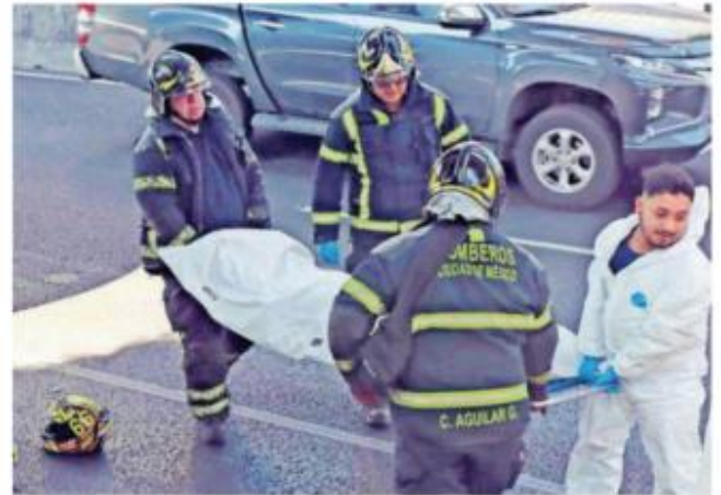
Peritos llegaron y realizaron las diligencias necesarias, levantaron el cuerpo y lo llevaron al anfiteatro, en espera de que familiares lo reconozcan