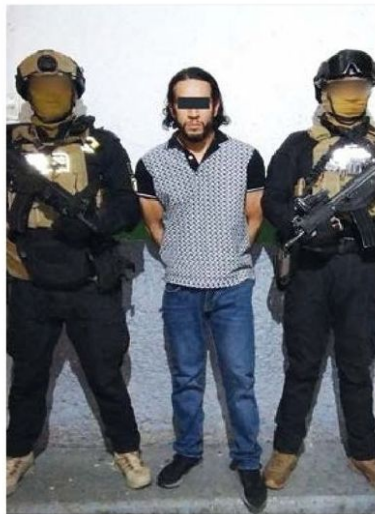
INDAGATORIAS. Eduardo N. y su pareja sentimental fueron detenidos en reclusión por nuevas órdenes judiciales.

Otro equipo asistió al Centro Femenil de Reinserción Social Santa Martha Acatitla para ejecutar la orden de aprehensión en contra de la mujer.