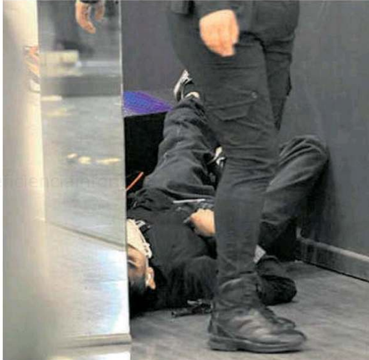
El cuerpo quedó fuera de la tienda, luego del frustrado asalto