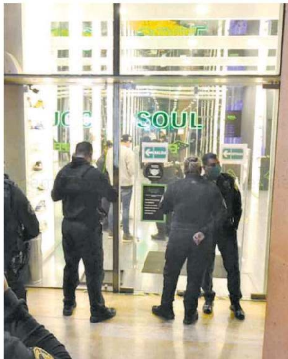
Gran presencia policiaca luego de oírse el tiroteo en la tienda deportiva