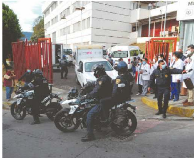
Cuatro motocicletas custodiaron cada brigada

El primer inspector recordó en entrevista con este diario que la SSC asignó a 144 elementos para cuidar esta etapa de la vacunación. Cuentan con 96 motocicletas para acompañar a 48 brigadas móviles que en Magdalena Contreras operan 20.