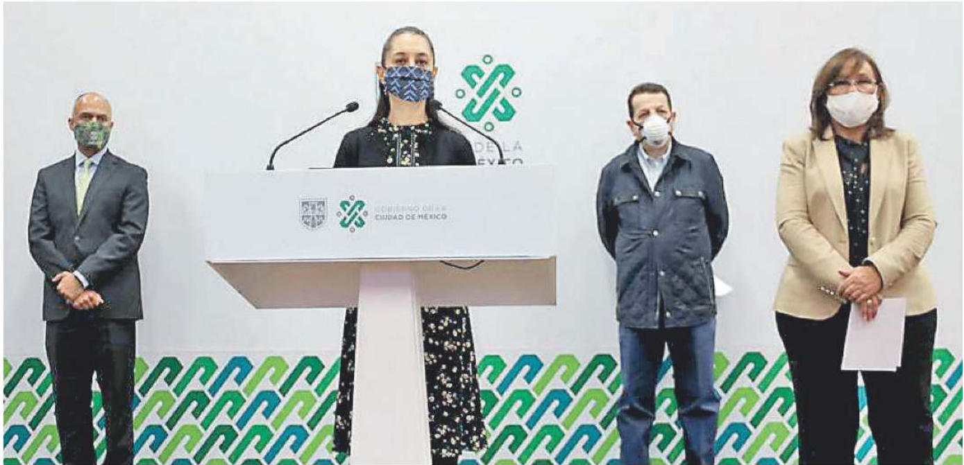
Ante los mensajes falsos, Sheinbaum pidió a los adultos mayores de otras demarcaciones tener paciencia con la vacuna. Especial