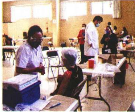
Las brigadas de vacunación acudieron ayer a diferentes asilos para inocular a los adultos.