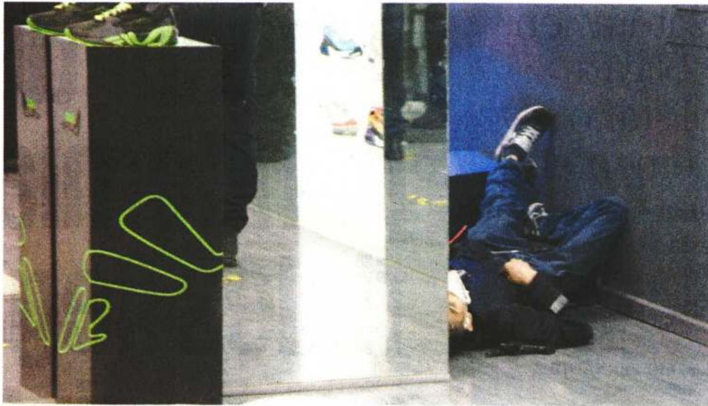
Al arribar al lugar de los hechos, los uniformados constataron que el sujeto herido por los disparos había perdido la vida.