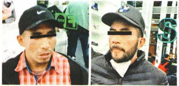
De acuerdo con los reportes oficiales, los sujetos intentaron robar la tienda de tenis con razón social Soul.