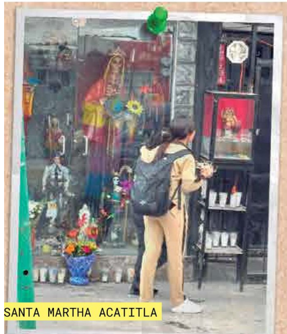
SANTA MARTHA ACATITLA