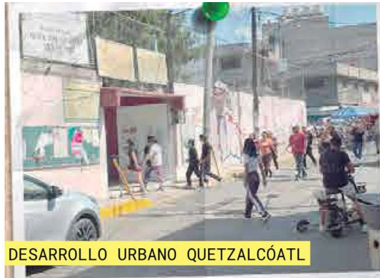
DESARROLLO URBANO QUETZALCÓATL

Otra de las mamás narró: “Nosotros vivimos a la vuelta y apenas el jueves pasado a mi vecino le robaron su camioneta a las 3 de la mañana, y a mi otro vecino se le han tratado de meter a la casa dos veces en lo que va de este año”.