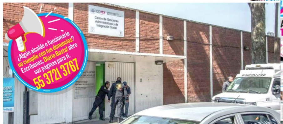
Algunos cobran por adelantado para realizar el trámite y desaparecen con el dinero