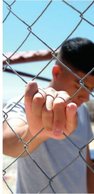
· Por las leyes mexicanas

En total hay cinco mil 334 presos en las correccionales para menores, mientras que mil 768 de estos encarcelados son mayores de entre 18 y 24 años, pues de acuerdo con las leyes mexicanas a un delincuente que ya tiene ciudadanía se le procesa o castiga mediante las reglas de justicia para adolescentes, si el delito lo cometió mientras aún no llegaba a esta edad.