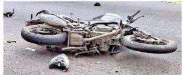
El motociclista quiso ganarle el paso y perdió el control de su vehículo para después terminar impactado en la parte trasera de un camión.

Automovilistas que pasaban por el lugar de inmediato llamaron a los servicios de emergencia para una pronta atención de los lesionados