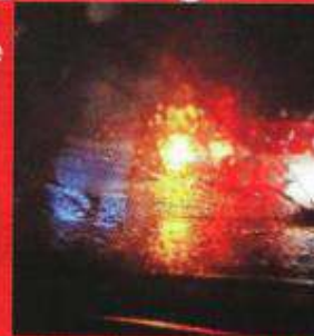
Los tres maleantes quebraron el parabrisas del automóvil familiar.

Pese a las maniobras del hombre, que viajaba con su mujer y su hija, pa-