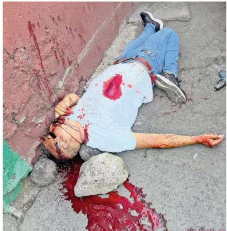
El hombre quedó bocarriba con un arma de fuego a un costado

Los hechos se registraron en dicho parque ubicado en la calle Juan de la Barrera esquina con Norte del Comercio, colonia La Conchita, alcaldía Tláhuac