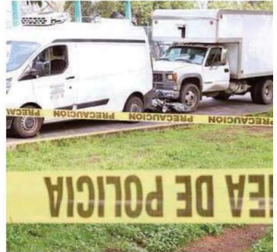
El accidente ocurrió sobre la Avenida 503 en su cruce con el Eje 3 Norte, Ángel Albino Corzo