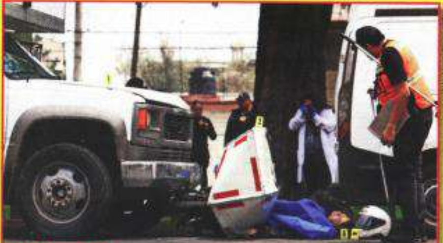
LO EMBISTIÓ Y PRENSÓ CONTRA UNA CAMIONETA