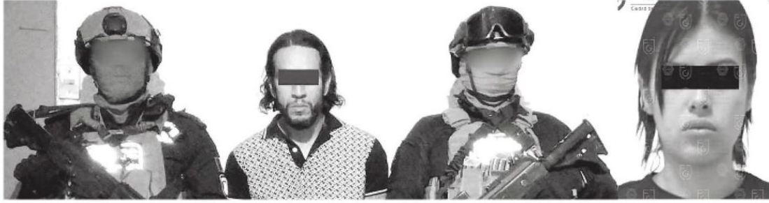
Les van a dar donde más les duele, en el dinero