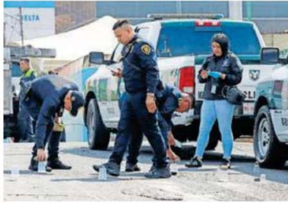
En el lugar hallaron nueve casquillos percutidos y dos de ellos le dieron directo a la cabeza, lo que provocó que perdiera la vida