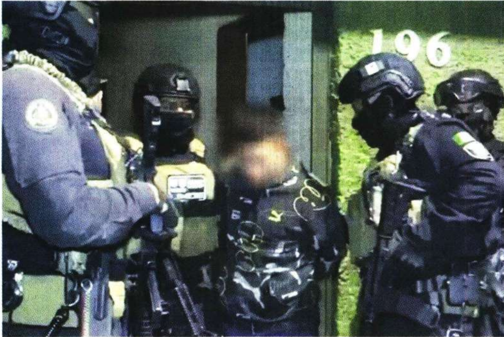
Fuerzas locales y federales realizaron de forma coordinada los operativos en las dos alcaldías.