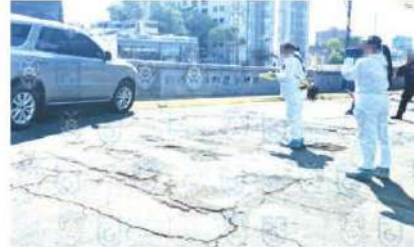
La víctima impactó su camioneta sobre la barda de la vialidad. Especial