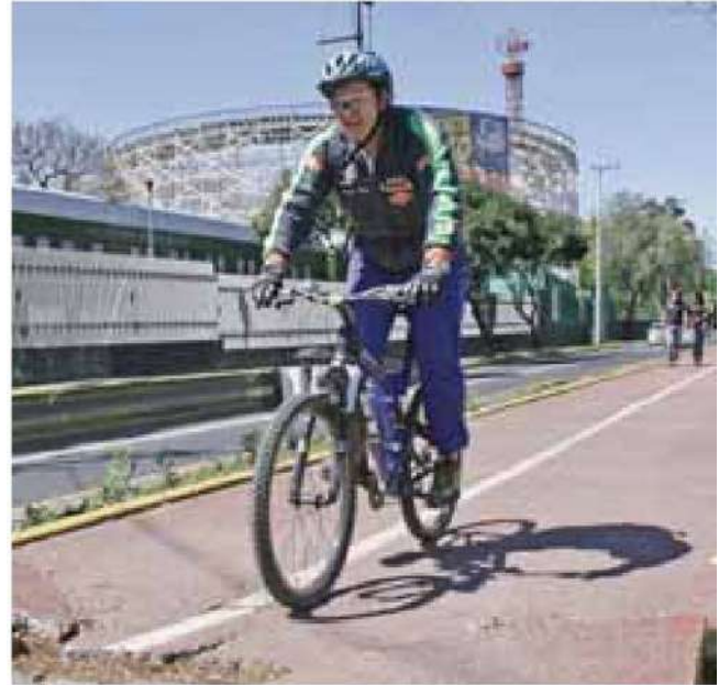
Movilidad. Obras para instalar ciclovías y ajustar peatonalización empezarán pronto en calles de la Cuauhtémoc.

Rojo de la Vega reiteró que dichas acciones (que costarán cinco mdp) responden a la necesidad de innovar a la alcaldía Cuauhtémoc, que es visitada a diario por más de seis millones de personas (11 veces la población residente) y donde las necesidades son claras: infraestructura para transporte público y movilidad alternativa, propiciar el desarrollo local, transporte público seguro y calles construidas pensando en el peatón.