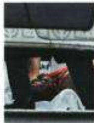
La abogada recibió tres tiros, que le perforaron la cabeza y el tórax.

Cuando llegó, encontró a la mujer herida en el asiento y minutos después paramédicos confirmaron que ha-