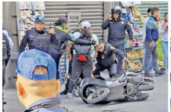
Vendedores y personas que iban caminando por la calle fueron quienes dieron aviso a los servicios de emergencia y de inmediato llegaron, mientras varias personas presentaron una crisis nerviosa