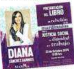
La también activista tenía previsto presentar un libro la próxima semana.