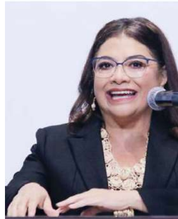
ADVERTENCIA. Clara Brugada, aclaró que ningún policía puede cometer abusos.

De esta forma, la jefa de Gobierno adelantó que en breve solicitará a los elementos de la SSC que den información precisa a los conductores y no piensen que las anteriores licencias permanentes perdieron su validez.