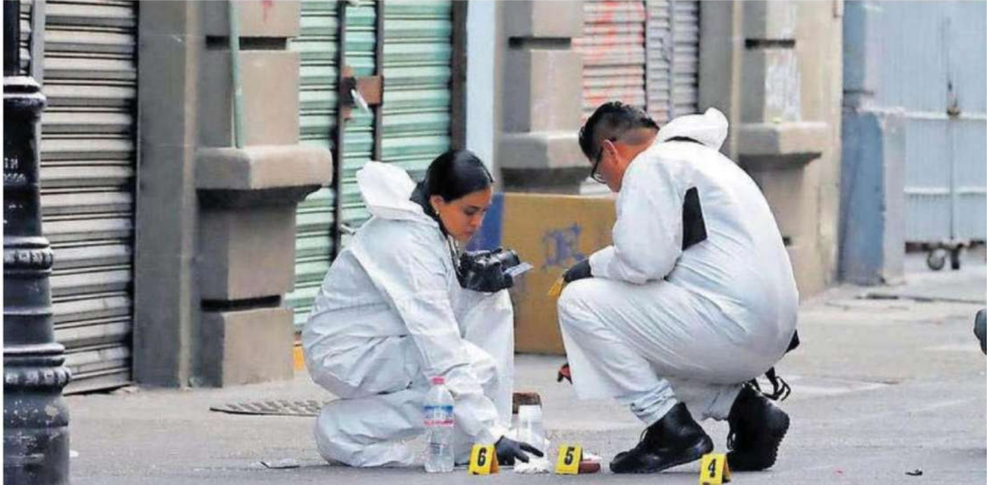
Peritos de la Fiscalía, recolectando evidencias del ataque.