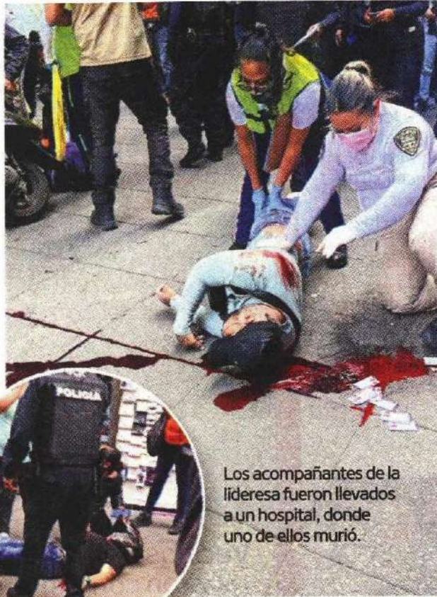
Los acompañantes de la líderesa fueron llevados a un hospital, donde uno de ellos murió.