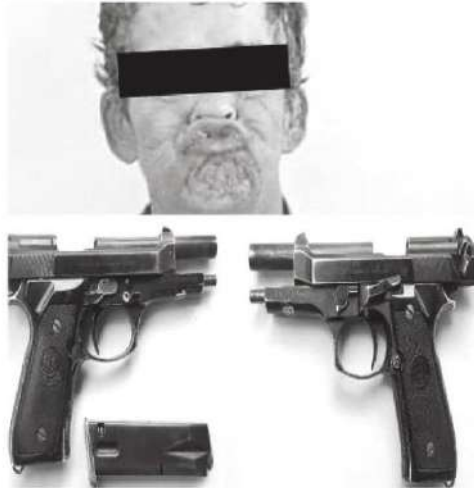
Quiso hacerse el chistoso

Los vecinos de la colonia fueron los que avisaron a las autoridades, por el fuerte escándalo que provocaban