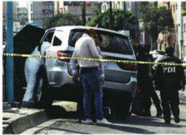
ROMA SUR. Tras el ataque a balazos, la camioneta que conducía la filigrante chocó.