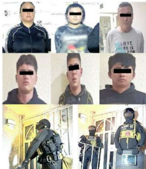
La policía los sorprendió en sus guardias

Los cuatro detenidos en tierras iztapatalapenses pertenecen a un grupo delictivo de la zona