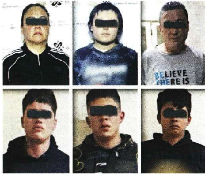
ROSTROS CUBIERTOS POR LA AUTORIDAD

Los detenidos fueron puestos a disposición del agente del Ministerio Público para determinar su situación jurídica.