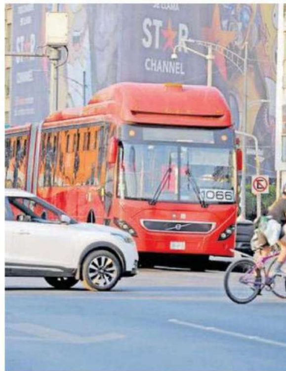
El Metrobús constituye una red de servicio de mil 541 kilómetros de longitud aproximada

“Por lo general, los vehículos particulares, ya sean autos o motocicletas, son quienes invaden el carril confinado y se dan los accidentes”