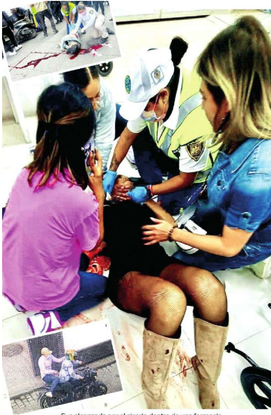
· Fue alcanzada por el sicario dentro de una farmacia