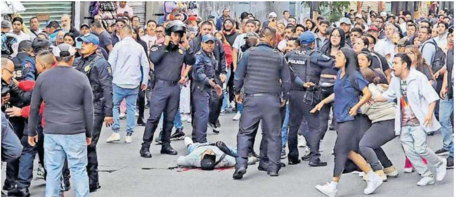
Los hechos se registraron en la calle de Motolinía esquina con 5 de Mayo, alcaldía Cuauhtémoc