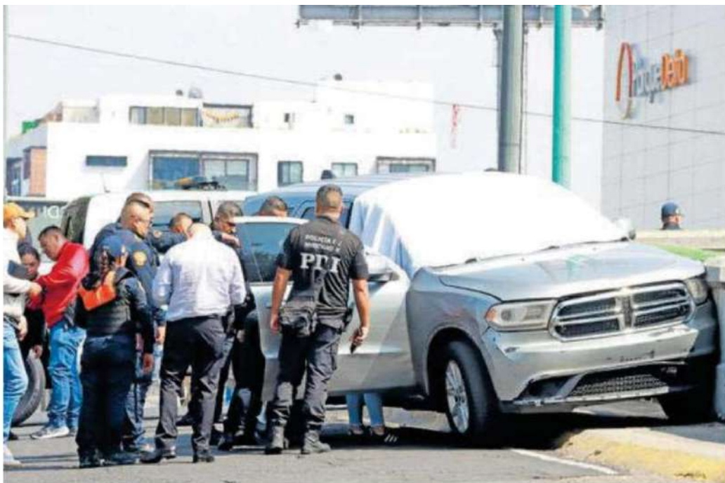
El cuerpo fue bajado por la parte trasera de la camioneta mientras que las autoridades continuaban haciendo su cerco