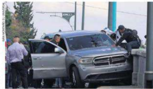
Tras los disparos, el vehículo de la abogada terminó impactado en un poste de luz.

Hasta el momento se desconoce el móvil de la agresión; sin embargo,