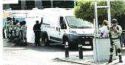
La zona del homicidio, donde hallaron nueve casquillos, fue acordonada y resguardada por fuerzas locales y federales.