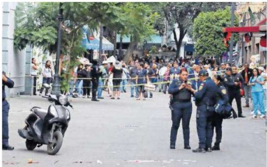
Los curiosos de siempre, frente al lugar de los hechos.

El próximo martes, la activista tenía programada la presentación de su primer libro sobre los derechos de los comerciantes en el espacio público.