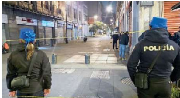
POLICÍAS capitalinos resguardan la zona de la calle Motolinía en la que ocurrió el atentado, ayer.