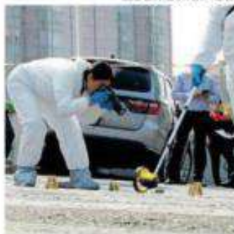
En el lugar se hallaron 9 casquillos