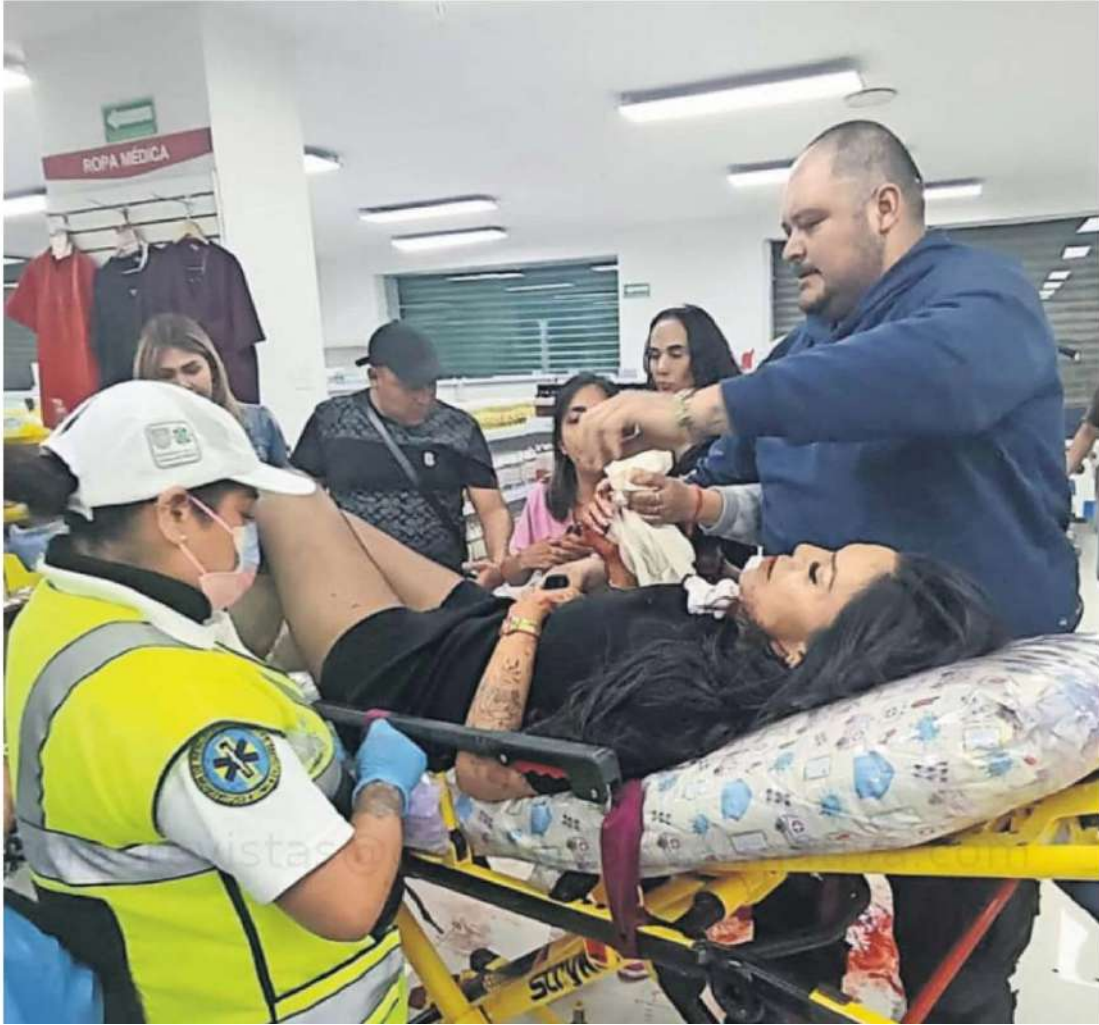
En calles del Centro Histórico, un hombre se acercó a la líder de comerciantes y sus acompañantes y empezó a dispararles; ella fue llevada a un hospital de la alcaldía Benito Juárez, donde se informó que sería operada.