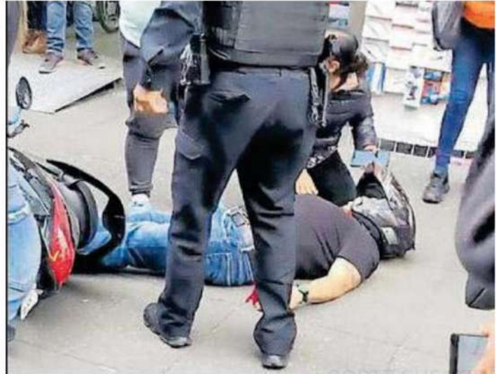
Comerciantes de la calle de Motolinía prendieron dos veladoras debido a que en el lugar había demasiadas manchas hemáticas en el suelo