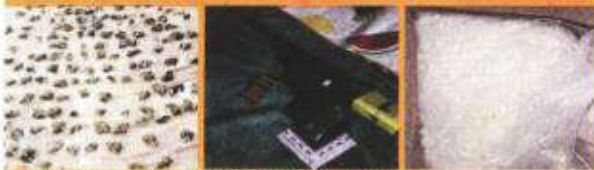
Elementos locales y federales aseguraron armas y drogas.