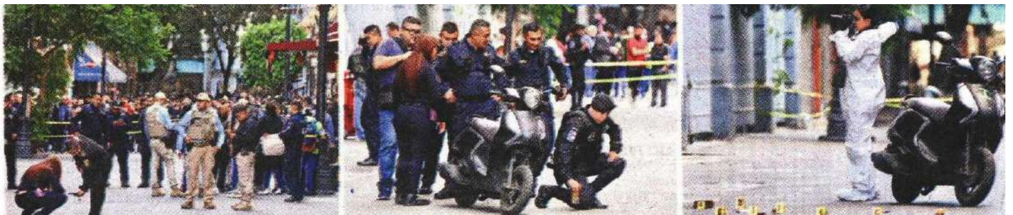
Al menos siete casquillos percutidos fueron contabilizados por peritos en el sitio del ataque, el cual quedó en custodia de policías.