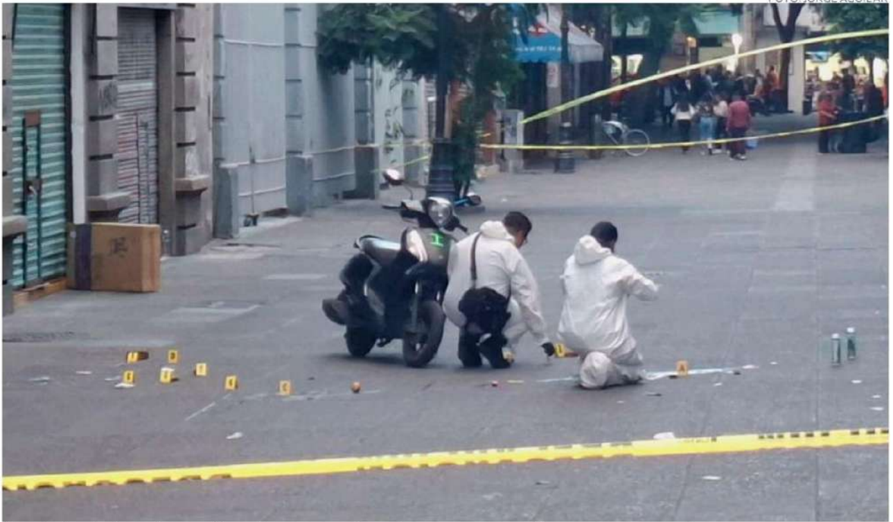
Locatarios bajaron las cortinas de sus negocios y las personas corrieron para resguardarse.