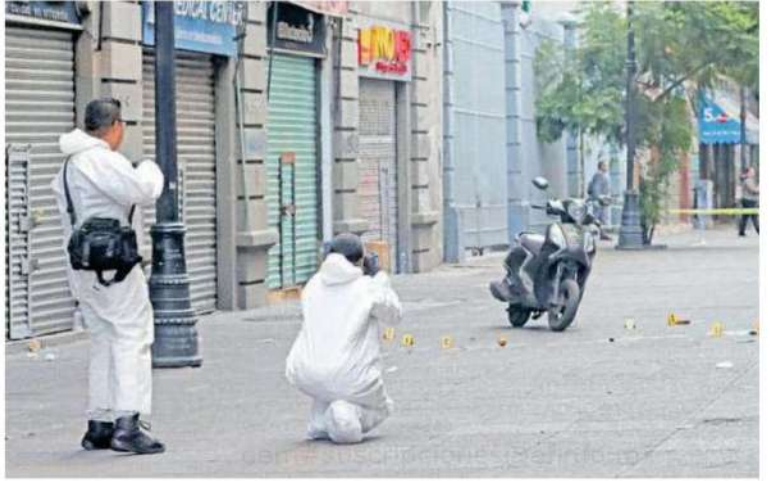
Después de 3 horas llegaron servicios periciales de la Fiscalía General de Justicia de la Ciudad de México a realizar las diligencias necesarias para continuar con las investigaciones