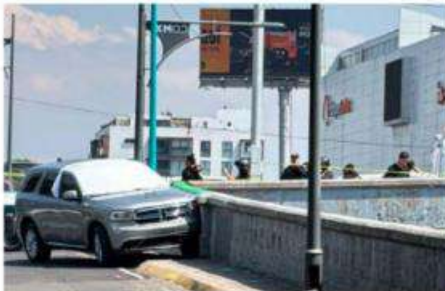
El feminicidio ocurrió en una de las avenidas más importantes de la CDMX.

Aparentemente, la mujer salió de un banco, cuando los sicarios la siguieron y la mataron, presuntamente para robarle el dinero en efectivo que retiró. • (Jorge Aguilar)