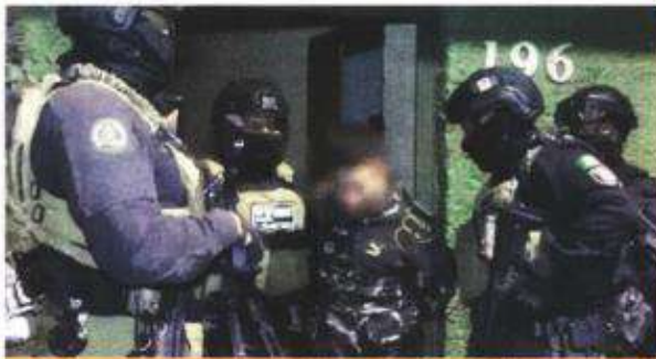
El primer cateo se realizó en la Colonia Escuadrón 201, en Iztapalapa.