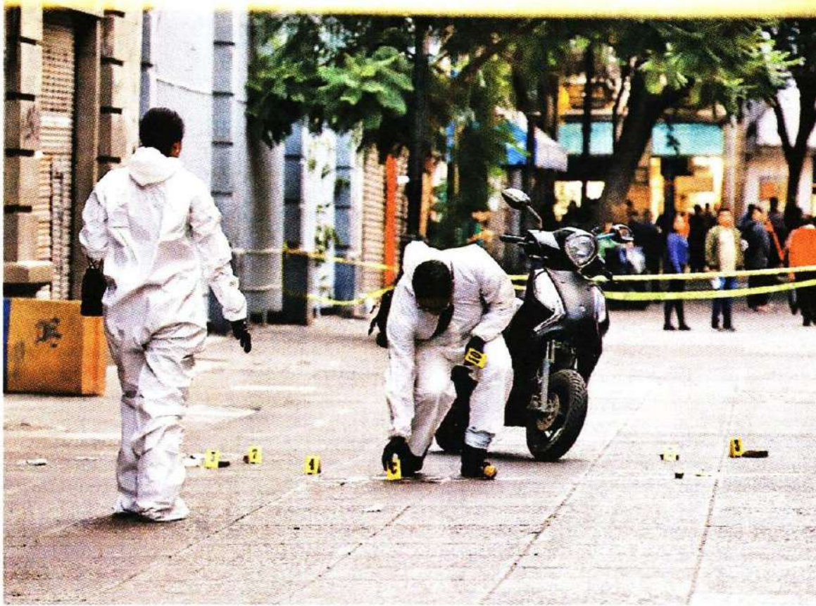
Peritos clasifican la evidencia en calle Motolinía. JESÚS QUINTANAR