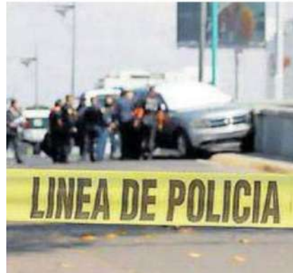
La camioneta en la que iba, sin placas