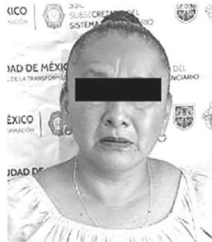
Era una lacrota

Las autoridades penitenciarias investigan a quien iba dirigida la droga al interior del Penal de Santa Martha.