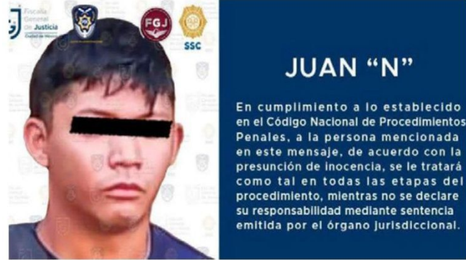
La Fiscalía aseguró que se le señaló a Alessandra que la carpeta físicamente se encuentra en el Estado de México y será posible tenerla en las siguientes 48 horas.

A pesar del dicho de la Fiscalía, Rojo acusó que solamente se le informó el plazo en el que podía consultar la carpeta, aunque nunca le explicaron en que unidad territorial se encontraba, por el contrario, el único argumento otorgado fue que debe de confiar en las autoridades. ● (Jorge Aguilar)