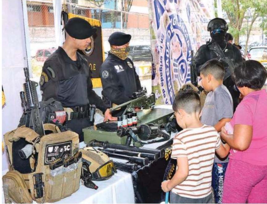
Se realiza Primera Feria de Seguridad en la explanada del Metro San Joaquín de la Línea 7; los niños fueron los más participativos