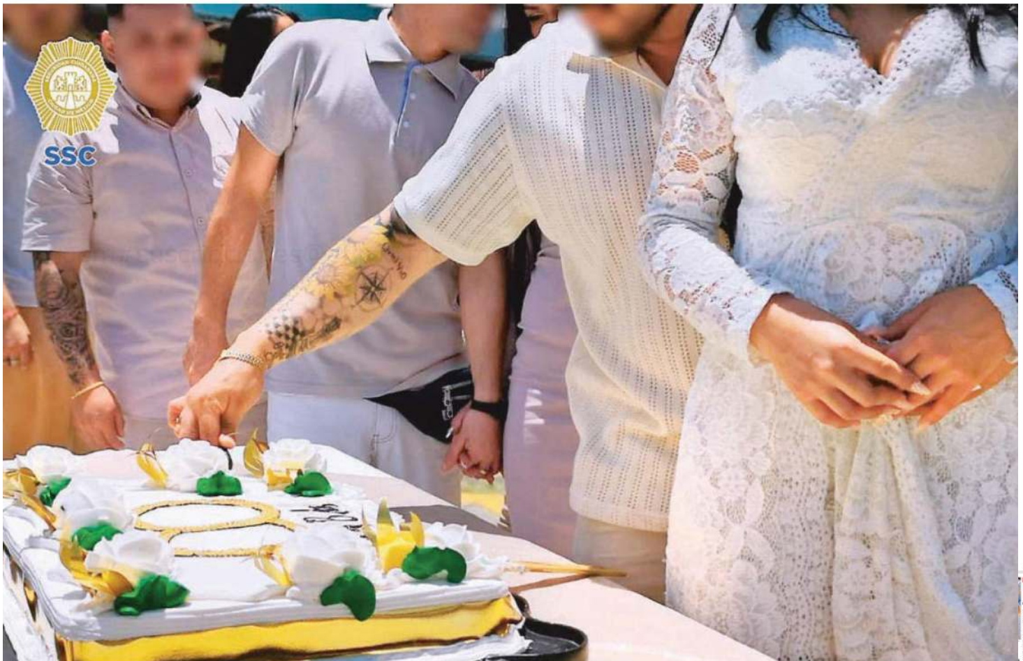
La Subsecretaría del Sistema Penitenciario de la Secretaría de Seguridad Ciudadana, en coordinación con la Secretaría de las Mujeres y la Dirección General del Registro Civil, todas de la Ciudad de México, realizaron el enlace matrimonial