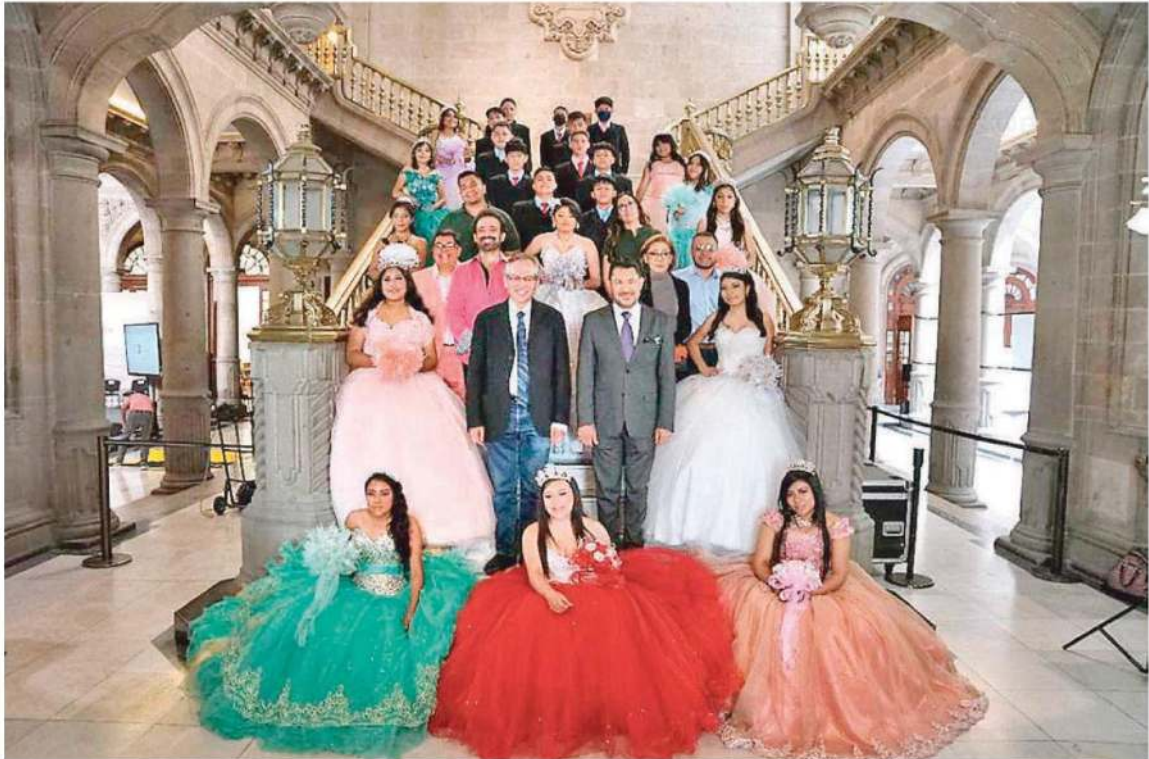
Encabeza la foto del recuerdo el jefe de Gobierno, Martí Batres, en el Antiguo Palacio del Ayuntamiento