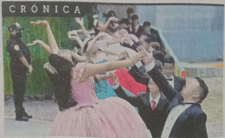
● Ayer celebraron 24 adolescentes sus 15 años en el patio de visitas del Penal de Santa Martha.

“Estoy intentando disfrutar al máximo, porque sí pienso que podría ser la última vez en tener a mis hi-