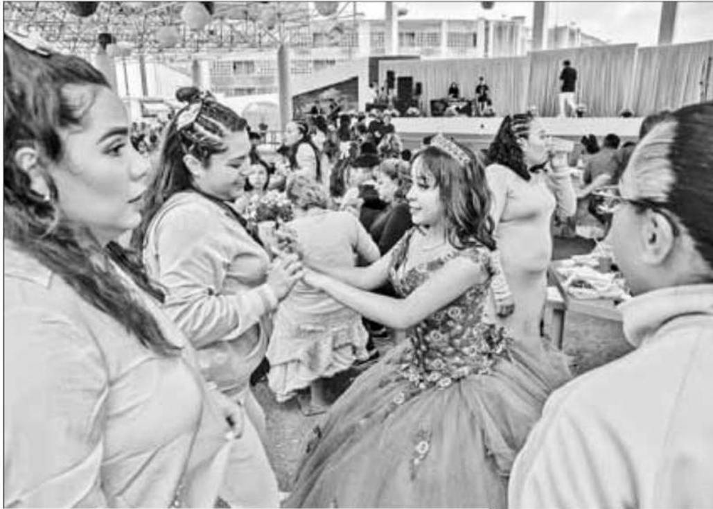
▲ Las más emocionadas eran las chicas, quienes bailaron el tradicional vals con sus madres, padrinos y otros familiares.