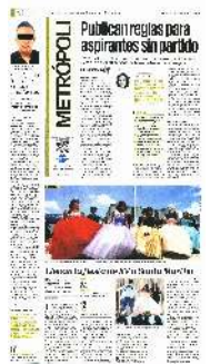
Los adolescentes cambiaron la tradicional fiesta de XV años por asistir a una misa y bailar el vals en compañía de sus madres en el penal.