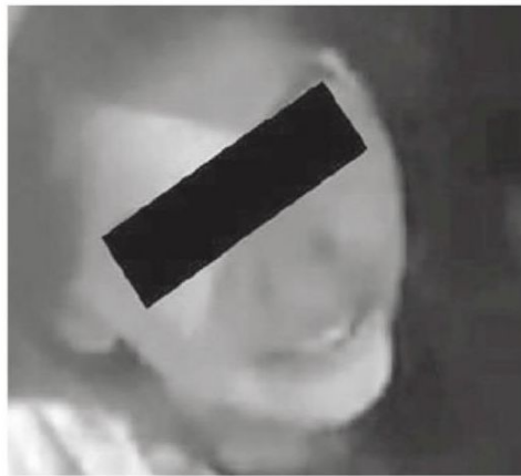
La responsable terminó detenida

Finalmente, las oficiales lograron subirla a la patrulla y la trasladaron ante el Ministerio Público.