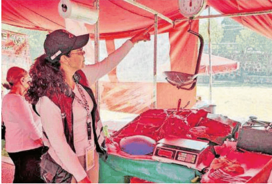
Intensifican revisión para evitar venta de pirotecnia y accidentes de gas