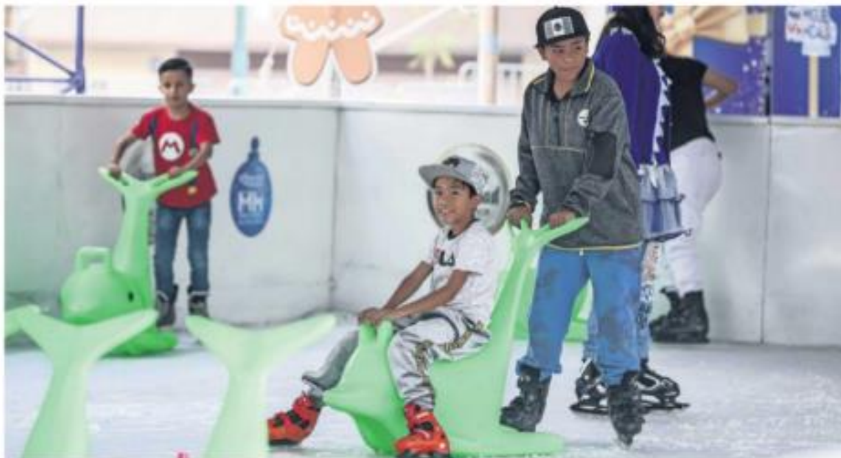
Algunos niños se apoyaron en focas de plástico para patinar. La pista de hielo estará abierta al público, de manera gratuita, hasta el 5 de enero.