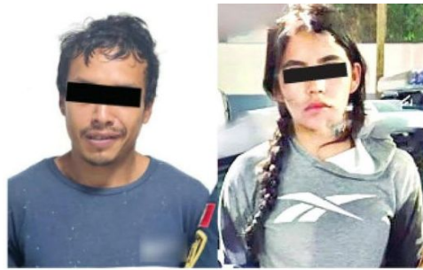
Se dedicaban a enganchar incautos

La cantidad robada fue regresada a la esposa del occiso.