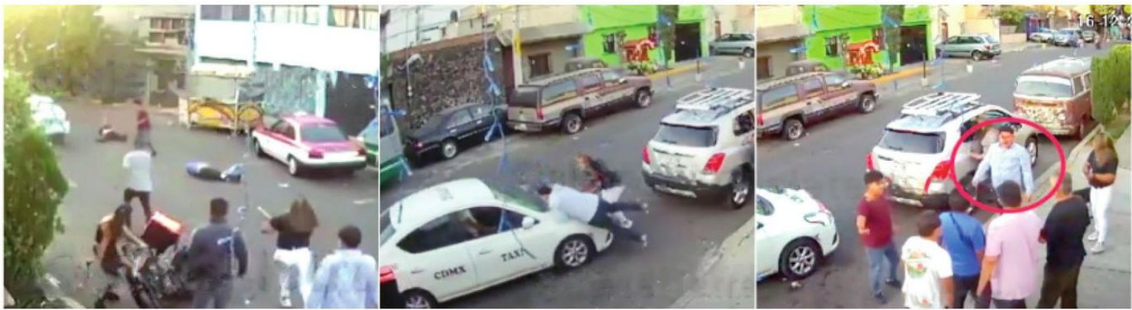
Chafiretes y colonos se dieron a llenar

De los hechos, se dio parte al agente del Ministerio Público correspondiente, quien realizará las investigaciones del caso y definirá la participación de las personas lesionadas en la riña.