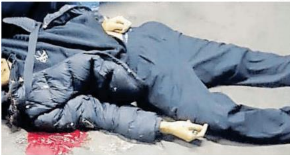
La víctima fue sorprendida y baleada por la espalda por lo que perdió la vida