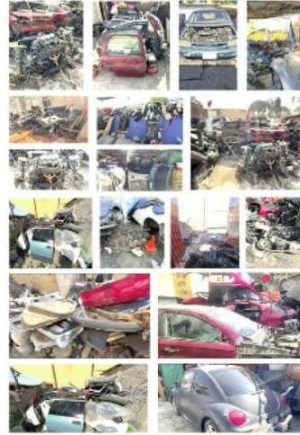
Todo esto tenían en su poder

Por último, los amantes de lo ajeno junto con lo asegurado fueron llevados con un representante social quien definirá su situación legal. Cabe señalar que, el cincuentón es líder de banda de rateros de la zona.