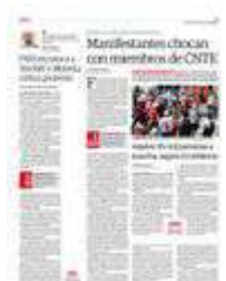
MIEMBROS de la Marea Rosa retiran una valla del campamento de la CNTE, ayer.