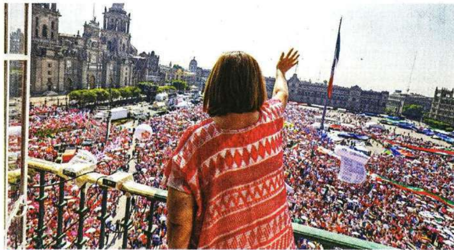
CLAMOR. La candidata presidencial Xóchitl Gálvez pidió entender la elección de 2024 como un llamado a la defensa de la República.