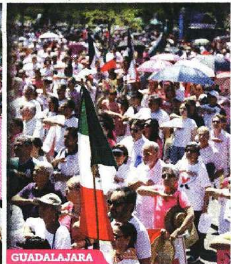
Vieja de la Cruz