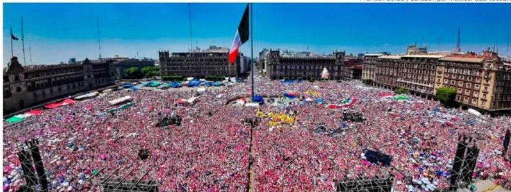
Decenas de miles de personas llegaron al Zócalo con la Marea Rosa por la Democracia.