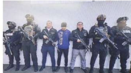
El sujeto afirmó que le pagaron 60 mil pesos por el crimen.

Dijo que remitieron ante el Ministerio Público a 218 personas, principalmente en las de Venustiano Carranza, con 61 detenidos; Iztapalapa, con 25; Álvaro Obregón, 16, y más".