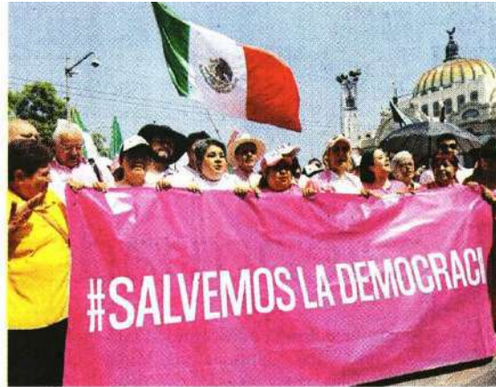
Los ciudadanos afines a la oposición promovieron ayer la participación en los comicios del 2 de junio.

El empuje de la “Marea Rosa” volvió a llenar el Zócalo. Esta vez con un multitudinario mitin justo a 14 días de la elección.