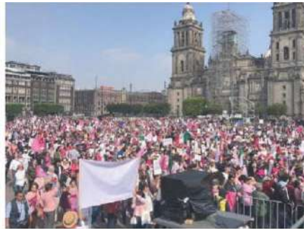
Manifestantes del mitin en la explanada del zócalo capitalino.

Pese a la algarabía de esos estimados, la Secretaría de Seguridad Ciudadana de la Jefatura de Gobierno de CDMX publicó que el mitin pro Xóchitl Gálvez de la ‘Marea Rosa’ tuvo un aforo de 95 mil personas con saldo blanco. A la par, detalló que mantuvo un operativo de seguridad y vigilancia en la zona. ●