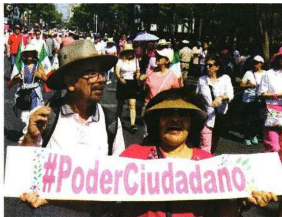
Con carteles, mantas o megáfonos, los manifestantes recorrieron las calles del Centro Histórico.