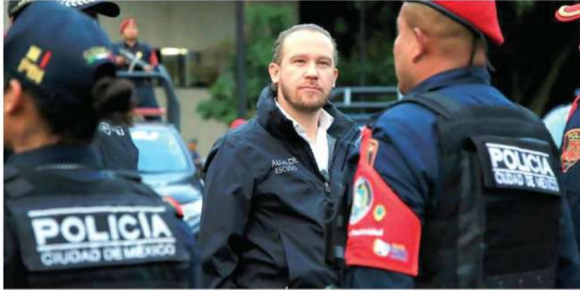
El panista ordenó rotular los automotores como si fueran patrullas