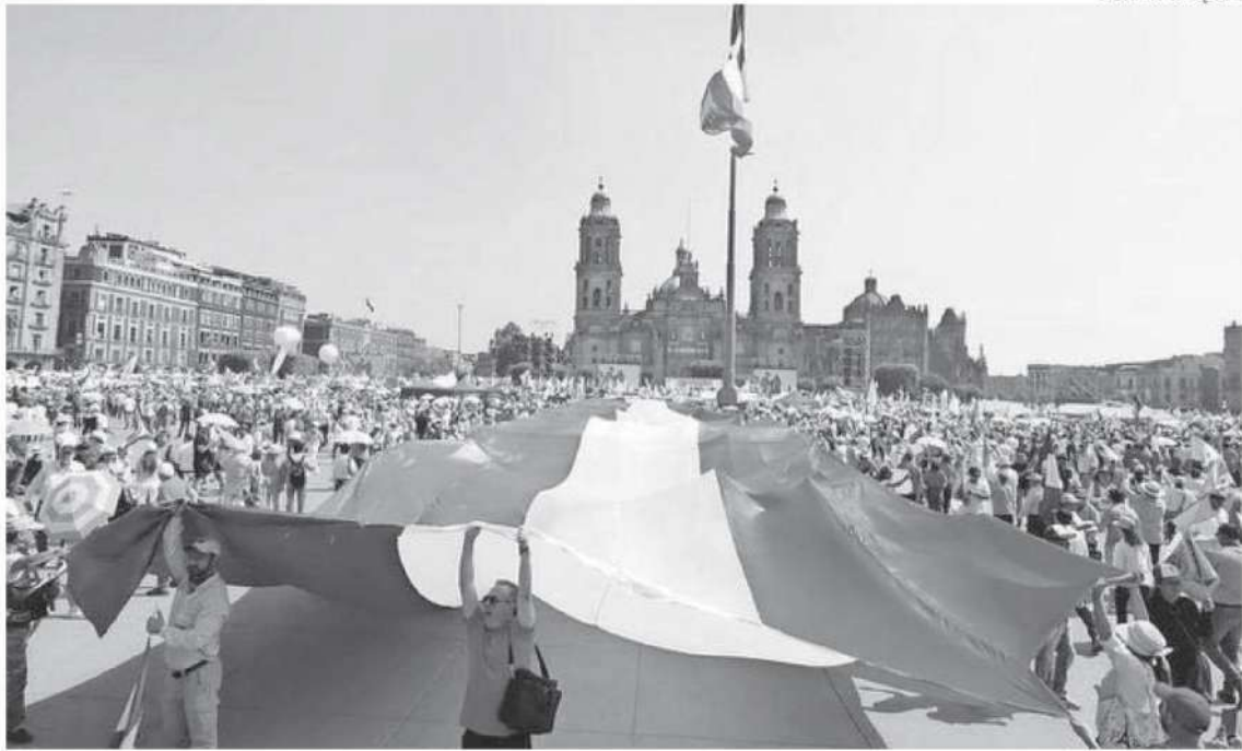
Ciudadanos arengan una gran bandera durante la concentración de la Marea Rosa en el Zócalo de la CdMx

dem #suscripciones@efinfo.mx ADRIÁN VÁZQUEZ