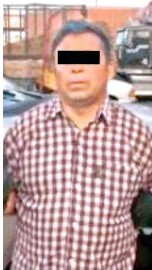
Los operadores del C2 Oriente ubicaron al posible responsable en la colonia Central de Abasto, fue detenido

El hombre de 70 años de edad quedó recostado sobre la cinta asfáltico con visibles manchas hemáticas en la cabeza