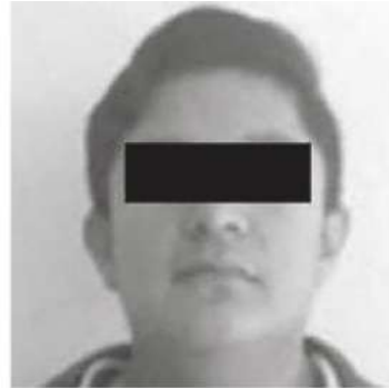
Se pasó de lanza

La mujer policía sufrió luxación de hombro y varios golpes en el cuerpo, por lo que fue hospitalizada