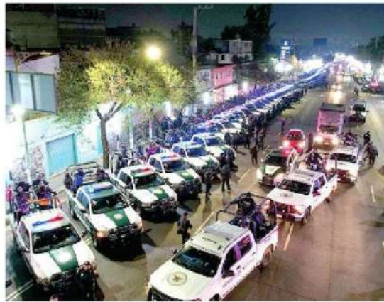
· Exitosos operativos en las 16 alcaldías

· Se realizaron más de 110 remisiones de peligrosos delincuentes