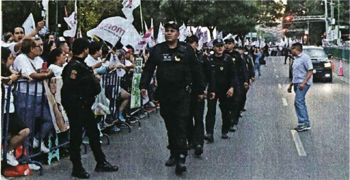
La Policía de la CDMX replegó a simpatizantes de Claudia Sheinbaum con vallas metálicas.