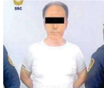
Detienen al presunto agresor y le aseguran la subametralladora

Por lo anterior, al hombre de 67 años de edad, se le informó el motivo de su detención, se le leyeron sus derechos de ley y junto con el arma de fuego corta asegurada, fue presentado ante el agente del MP correspondiente, quien determinará su situación jurídica.