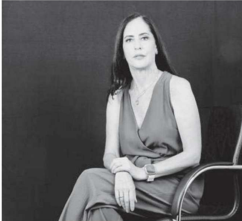
Lía Limón ganó los comicios de 2021 y busca ser reelecta en Álvaro Obregón