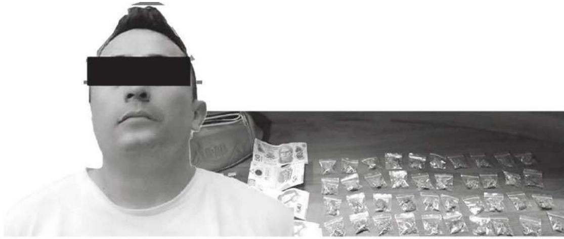
Le sacaron sus trapitos al sol