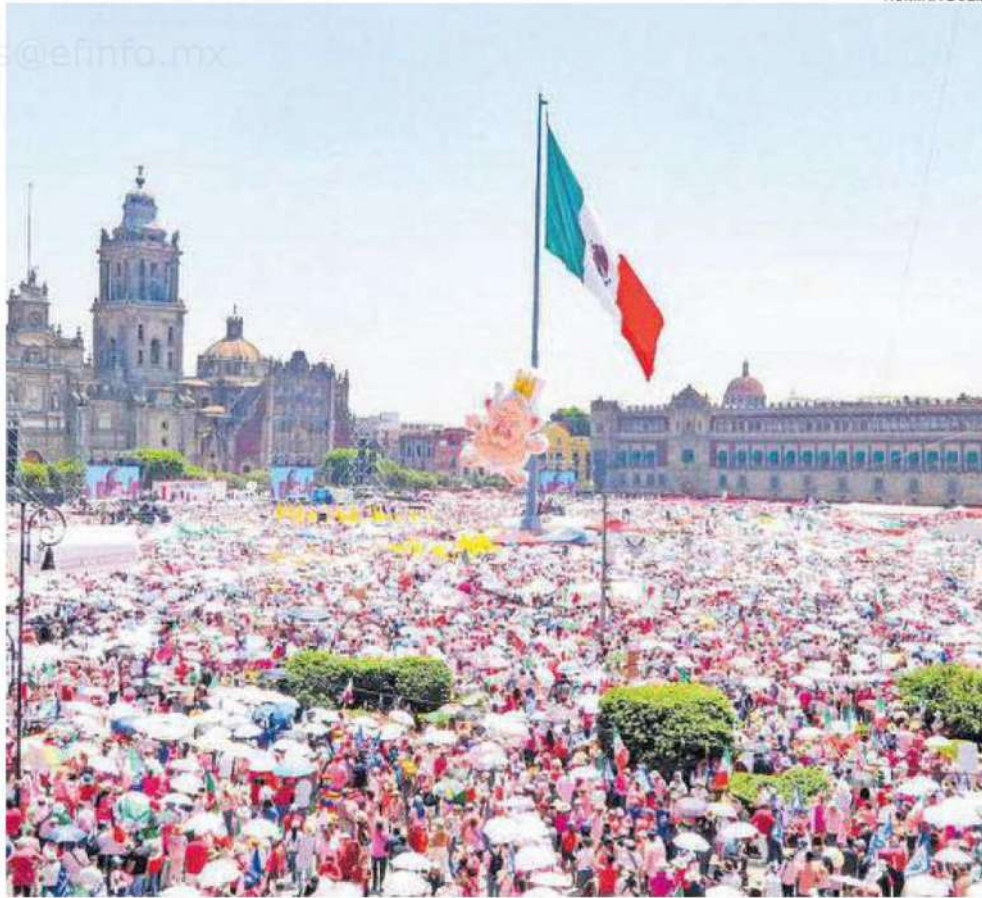
El Zócalo, a todo su esplendor con la Marea Rosa, ayer.