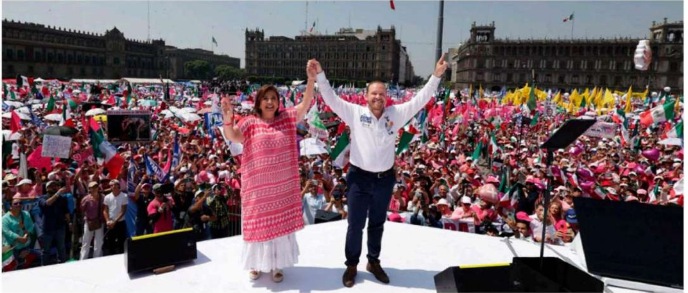
Xóchitl Gálvez y Santiago Taboada en la Marcha por la democracia en el Zócalo capitalino.