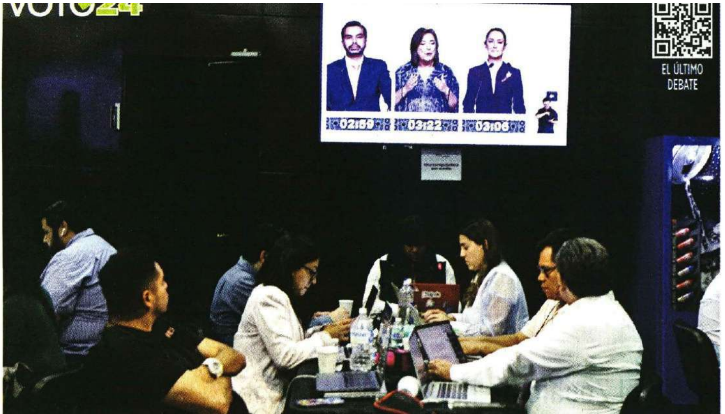
CUARTO DE GUERRA. Representantes de los medios de comunicación durante el tercer debate presidencial, en el Centro Cultural Universitario Tlatelolco, en la Ciudad de México.