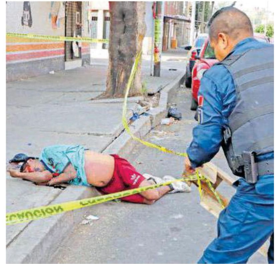
Paramédicos se acercaron a la víctima para brindar los primeros auxilios, pero una rápida revisión solo pudo determinar que ya no contaba con signos vitales