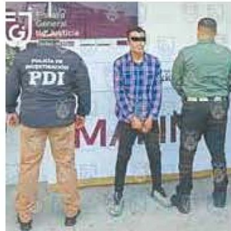
En febrero de 2012 lo acribilló.

Una vez bajo el resguardo de los ministeriales, Eduardo "N" fue trasladado a la capital del país para ser ingresado en el Reclusorio Preventivo Varonil Sur, donde el juez que lo requirió determinará su situación jurídica en los próximos días.