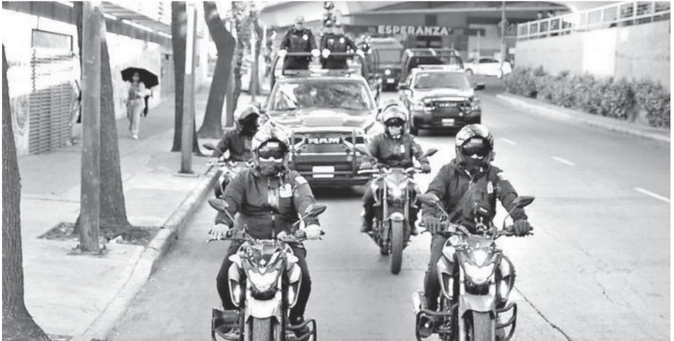
El alcalde Mauricio Tabe puso en marcha el operativo Blindar México-Tacuba