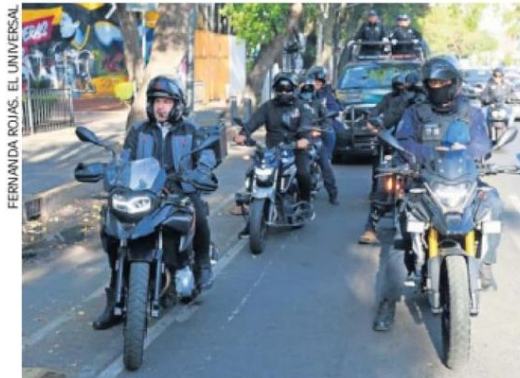
Se reforzará la vigilancia para que los vecinos de la zona estén más seguros, dijo el edil de MH.

Sin embargo, dijo, “los esfuerzos no paran y vamos por más”, por lo que insistirá con el Gobierno de la Ciudad para que la Calzada México-Tacuba se establezca como un sendero seguro. ● Redacción, con información de Juan Carlos Williams