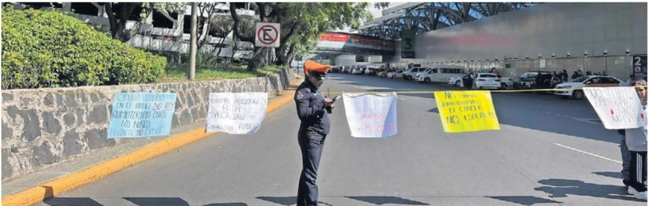
Los inconformes cerraron con un lazo la circulación vehicular en los accesos al AICM en la Terminal 1, frente a la puerta número 2.