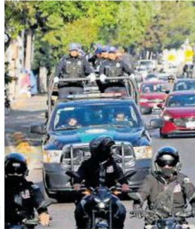
Atenderán los puntos conflictivos

El alcalde promete instalar 173 cámaras de vigilancia y habilitar el módulo de vigilancia de Lago Mask como centro de monitoreo