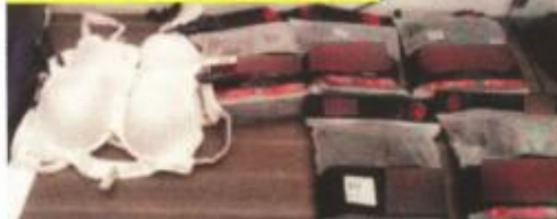
■ A los detenidos les aseguraron cinco paquetes de calcetines y cuatro brasieres.

Mientras que la mujer cuenta con un proceso por robo a transeúnte en vía pública en 2018.