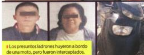
■ Los presuntos ladrones huyeron a bordo de una moto, pero fueron interceptados.