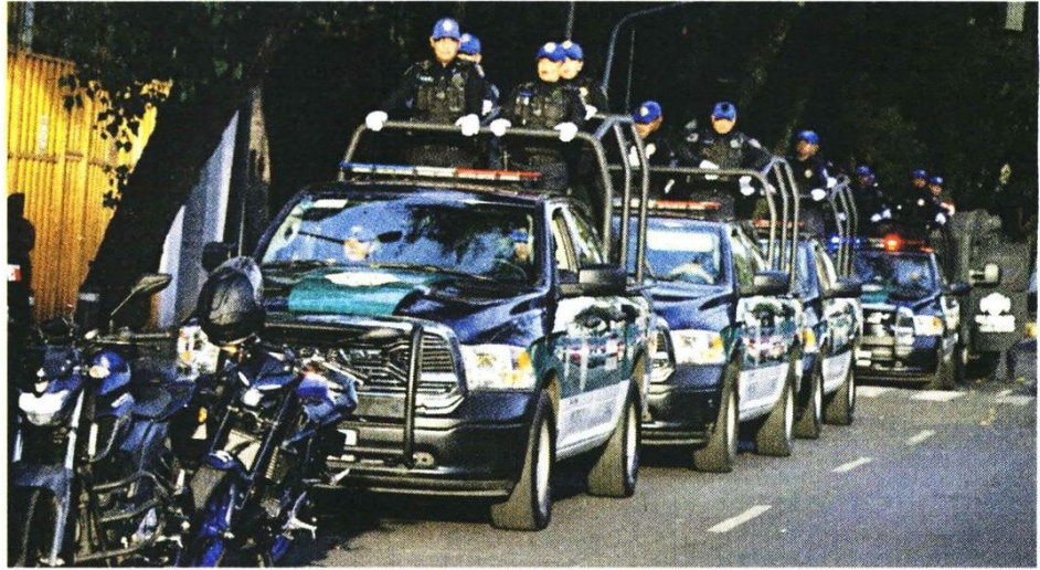
Seis vehículos serán utilizados para la labor de patrullaje en el Sector Tacuba.

Asimismo, además de sus propios esfuerzos, indicó que se buscará la coordinación con el Gobierno central, a cargo de Clara Brugada, para llevar a cabo políticas públicas que abonen a la construcción de la paz en la zona.