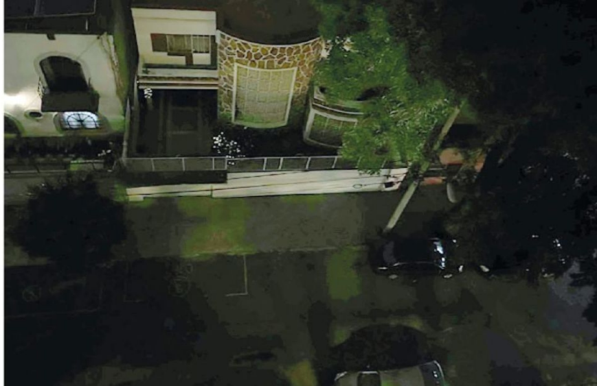
De octubre a enero se reportaron mil 95 quejas para la reparación del alumbrado