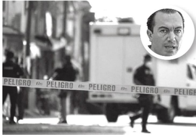
· Más del 120% en comparación al cierre del pasado gobierno