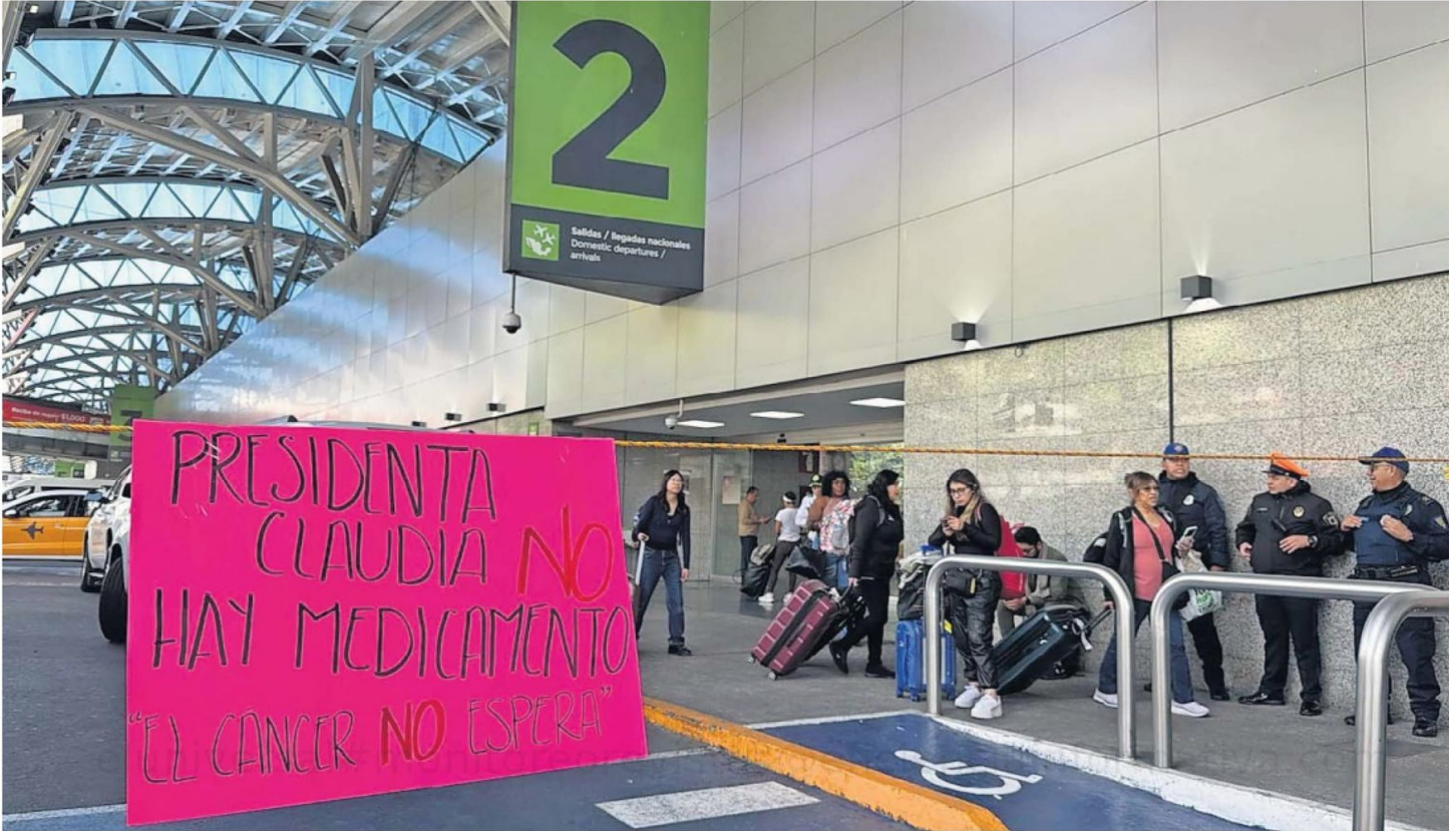
Más de cuatro horas duró el bloqueo a la altura de la puerta 2 del Aeropuerto Internacional Benito Juárez para demandar atención inmediata a los niños enfermos.