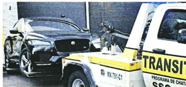
El vehículo fue llevado al Ministerio Público para integrarla a la carpeta de investigación.

La unidad, que aún se desconoce cómo terminó en el museo, fue puesta a disposición del Ministerio Público.