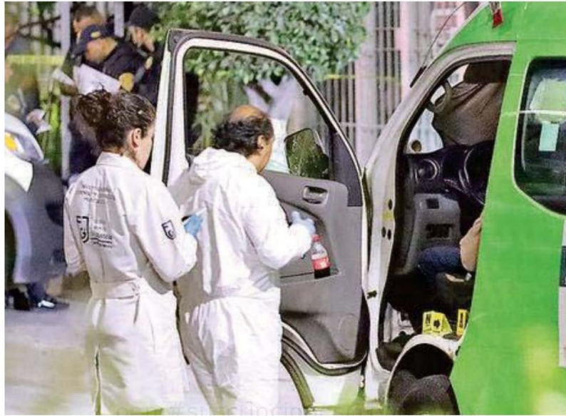
Pese al oportuno arribo de paramédicos de la Cruz Roja, la víctima murió casi de manera inmediata.