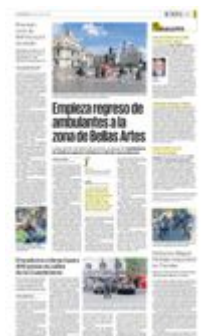
Desde las 8:00 horas del lunes comenzaron a instalarse algunos puestos de vendedores ambulantes; los demás lo harán este miércoles 21 de enero, según relató una comerciante.