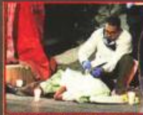
Peritos de la Fiscalía llegaron al lugar para levantar el cuerpo.

Tras la agresión, el hombre de unos 50 años cayó sin vida ante el asombro de los vecinos que pasa-