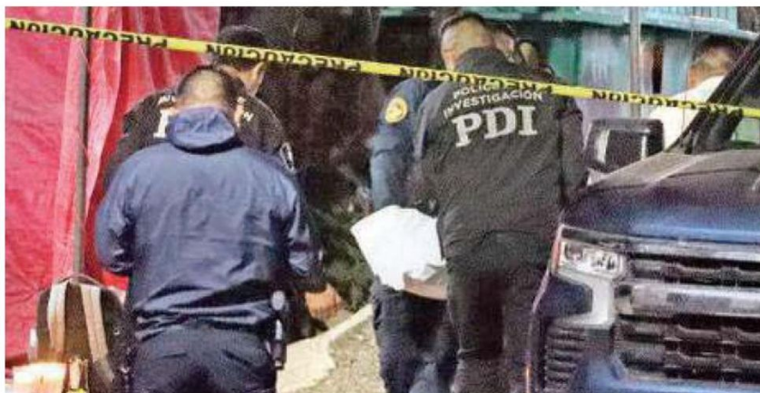
Los hechos se registraron en la calle de Chancenote y Kaua, colonia Pedregal de San Nicolás, 5ta. Sección