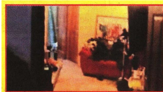
En la escena del crimen, agentes encontraron todo en desorden y una pistola calibre .38 milímetros.