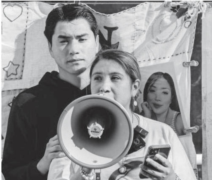
El colectivo Una Luz en el Camino se ha reunido con la fiscal