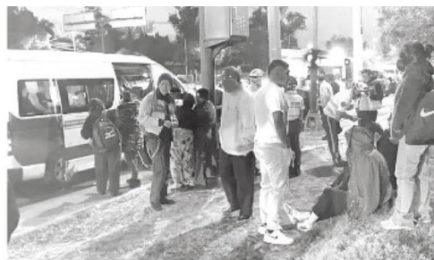
Socorristas atendieron a los lesionados

Las autoridades realizan los peritajes correspondientes para deslindar responsabilidades.