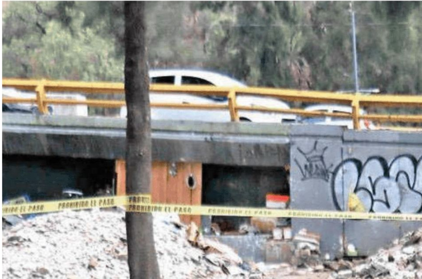
EL AHORA occiso había improvisado una vivienda para pernoctar