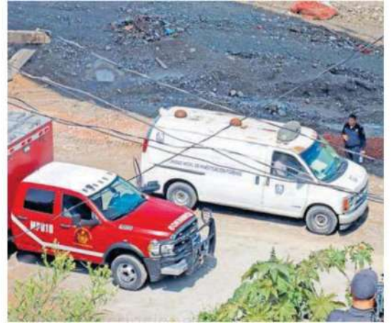
Fueron habitantes de la colonia y trabajadores de las obras de construcción del Tren Interurbano, que conectará a la Cdmx con la ciudad de Toluca, los que encontraron entre el lodo y el agua del canal al hombre