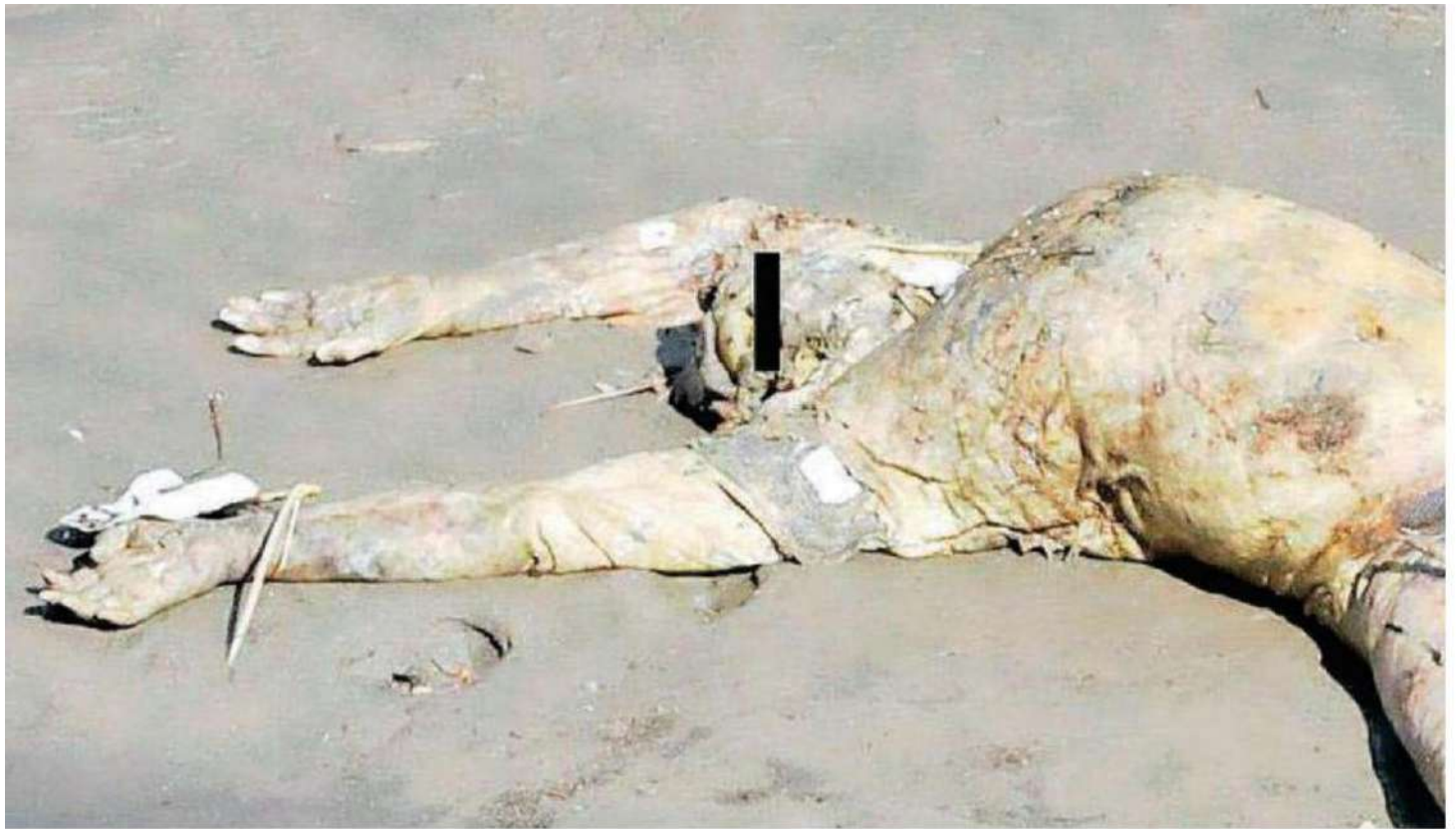
El cadáver de la víctima yacía tendido al interior del canal, muy cerca de la zona de caballerizas de la Exhacienda Belén de las Flores