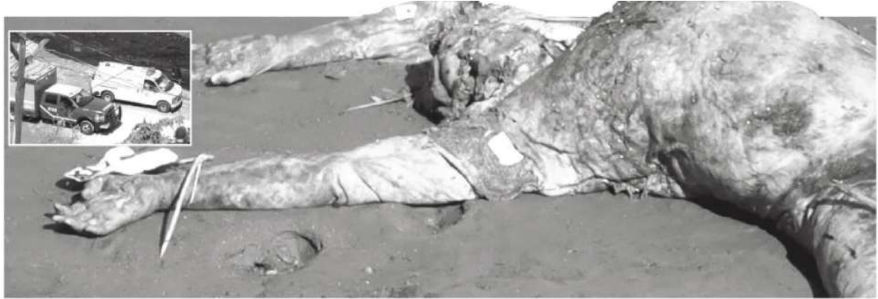
Ya se encontraba en estado de descomposición