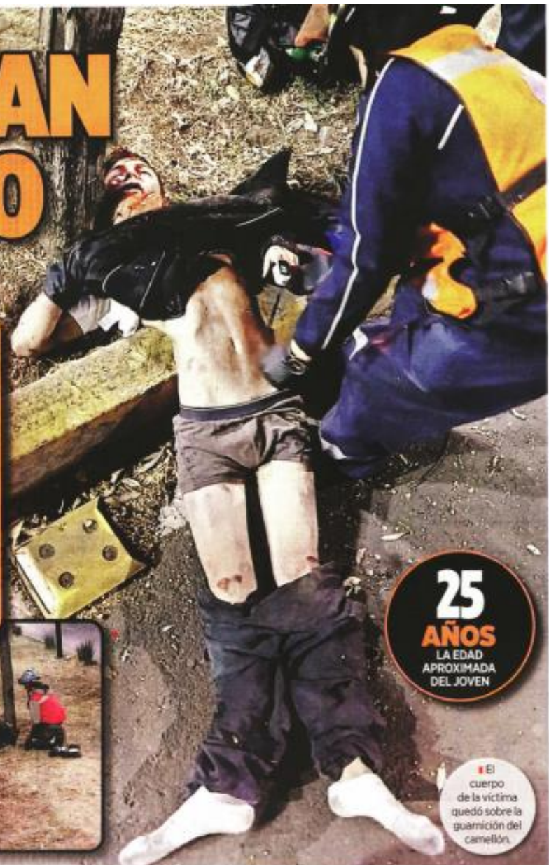
El cuerpo de la víctima quedó sobre la guarnición del camellón.