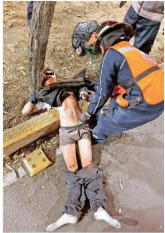
El torso del hombre quedó sobre el camellón y la otra mitad del cuerpo sobre el asfalto; su cabeza se impactó en el tronco del árbol

Peritos de la Fiscalía General de Justicia de la Ciudad de México llegaron al amanecer para realizar las diligencias y el levantamiento del cuerpo, que permanece como desconocido