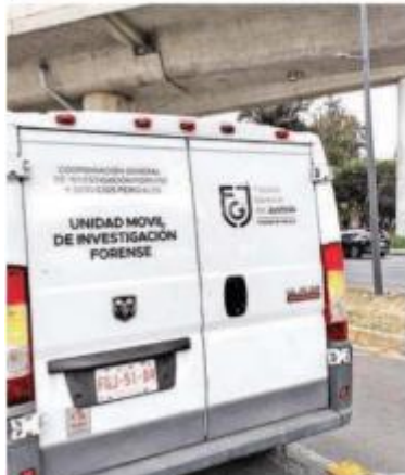
Un hombre perdió la vida al ser arrollado por un vehículo en Viaducto Tlalpan, a la altura de Periférico, colonia Belisario Domínguez, alcaldía Tlalpan.

Un hombre murió al ser arrollado por un vehículo cuando iba caminando en el camellón divisor del Viaducto Tlalpan. El conductor responsable se dio a la fuga.