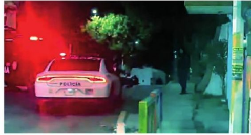
Noche violenta en Tlalpan

15 casquillos percutidos de diferentes calibres encontró la policía alrededor de los cuerpos.