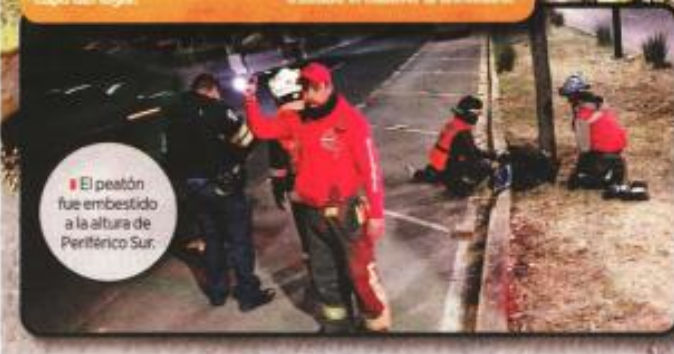
El peatón fue embestido a la altura de Periférico Sur.

El lugar permaneció bajo resguardo durante un par de horas, hasta que personal de la Fiscalía capitalina concluyó los peritajes y trasladó el cadáver al anfiteatro.