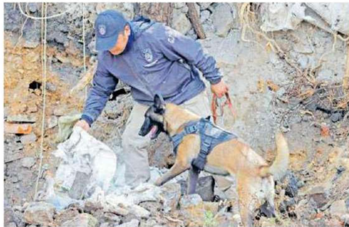
Con la presencia y acción de las autoridades, encontraron restos humanos, hecho sorpresivo para ellos y aquellos que buscan a sus desaparecidas