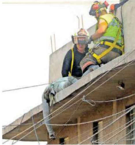
El desafortunado hombre salió proyectado y cayó de una altura aproximada a los cinco metros y murió de manera instantánea