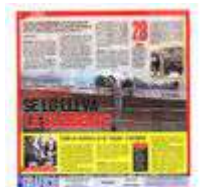
TUMBADO POR EL VIENTO