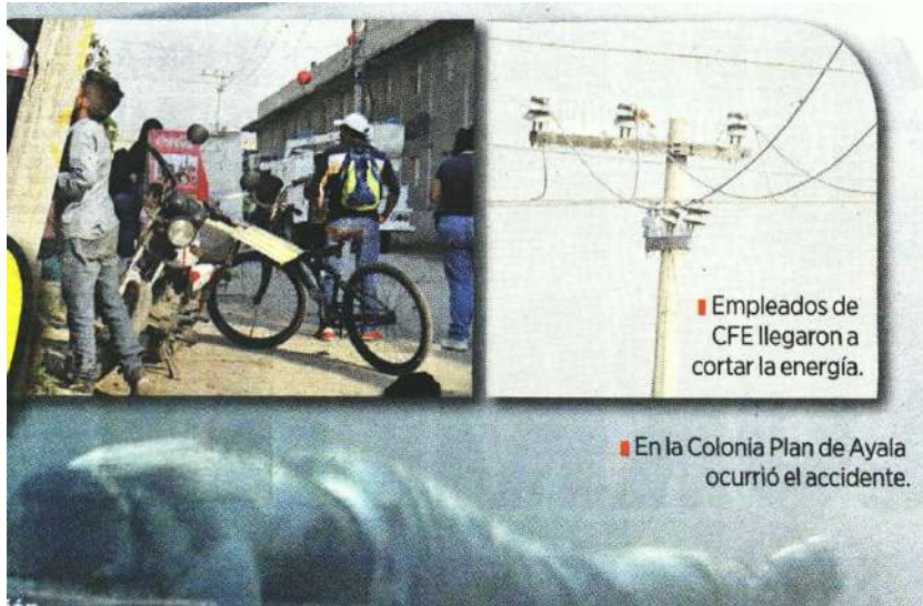
Fotografía: v. Albuerto. Amapa

■ Empleados de CFE llegaron a cortar la energía.