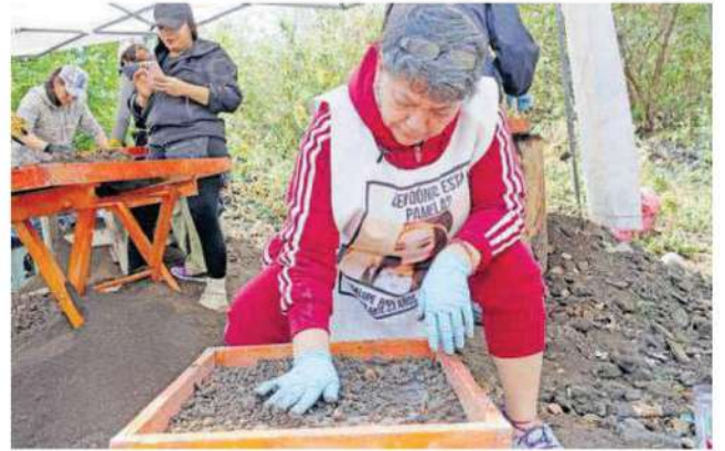
La inspección en dicho sitio fue propuesta de la familia de Pamela Gallardo y se llevará a cabo del 22 al 26 de abril de 2024