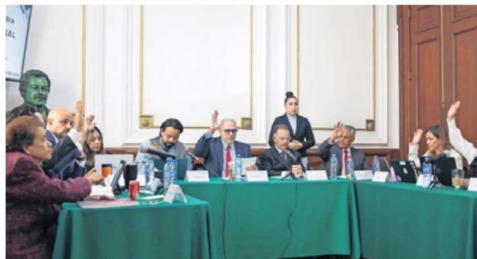
Los días 21 y 22 de noviembre, el Consejo Judicial Ciudadano entrevistó a los siete aspirantes a fiscal capitalino.

a la FGJ de la CDMX tuvieron buenas opiniones.