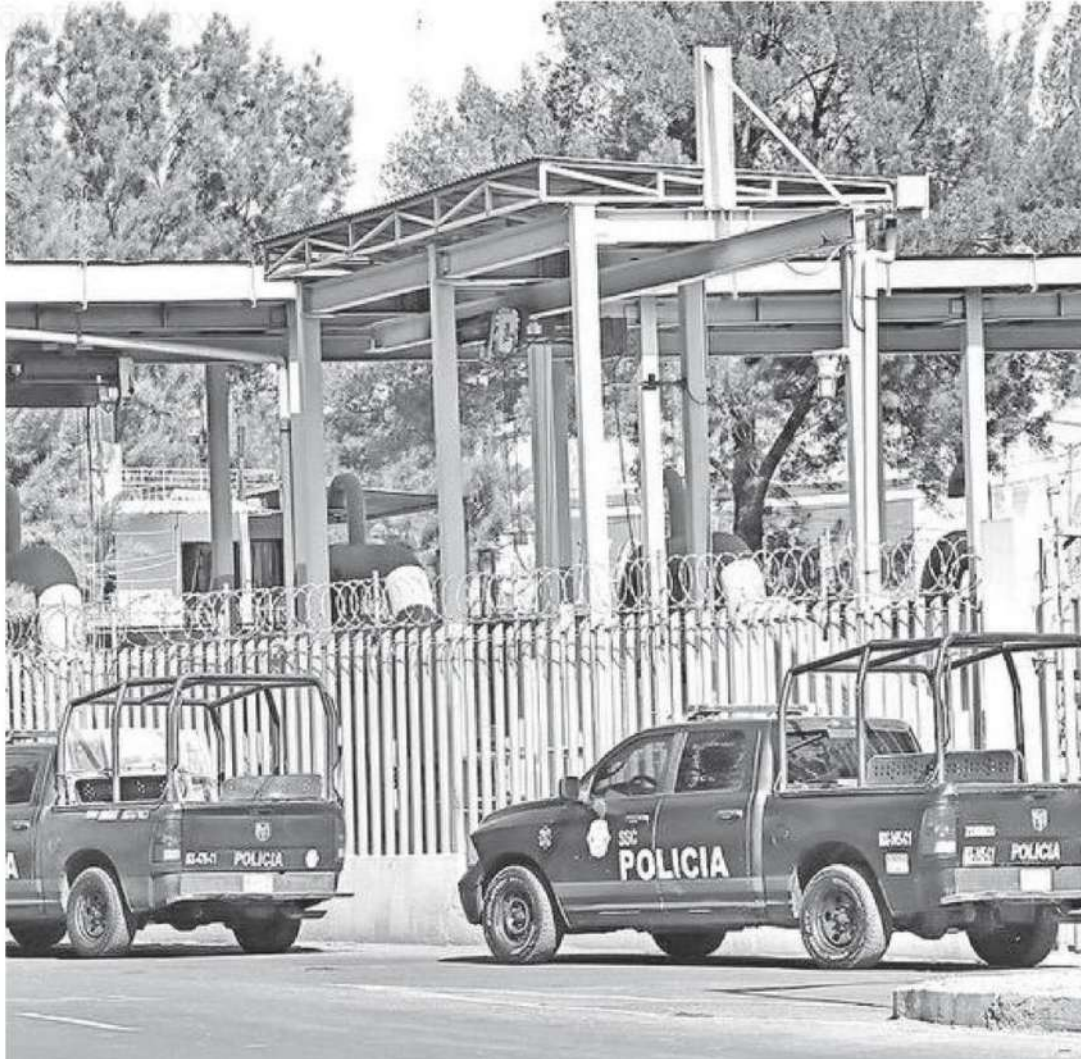
La ZMVM es la más grande del país, la quinta mayor del mundo y representa más de 22 millones de habitantes que confluyen diariamente en este territorio