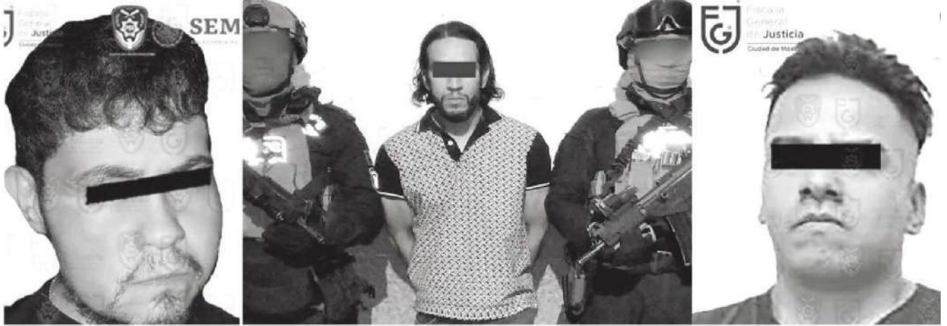
Las detenciones se realizaron por separado a lo largo de la última semana, de acuerdo con la SSC y Fiscalía