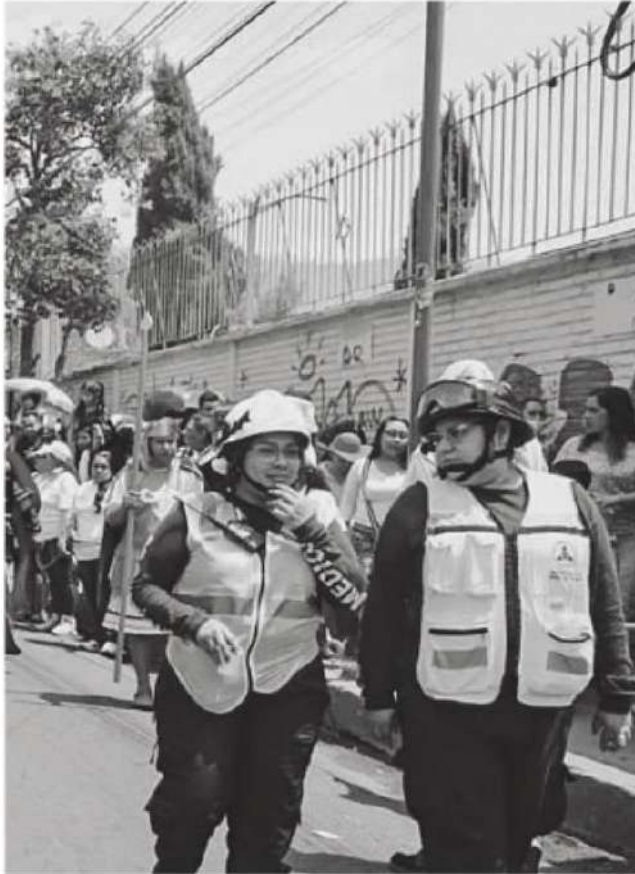
Seguirán el recorrido de La Pasión de Cuauhtepc