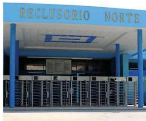
· A los reos, les transmitieron el debate

· En la CDMX, 1,572 personas se encuentran en prisión preventiva y podrán ejercer su sufragio