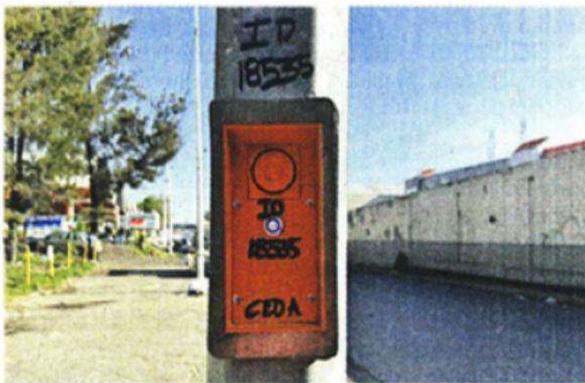
■ En la Ceda hay distribuidos 100 botones de emergencia.

También, se ha instrumentado un operativo especial de vialidad y vigilancia ante el incremento que se espera de visitantes en estos días, se estima que, al menos, medio millón de personas acudirán a buscar los mejores productos al menor pre-