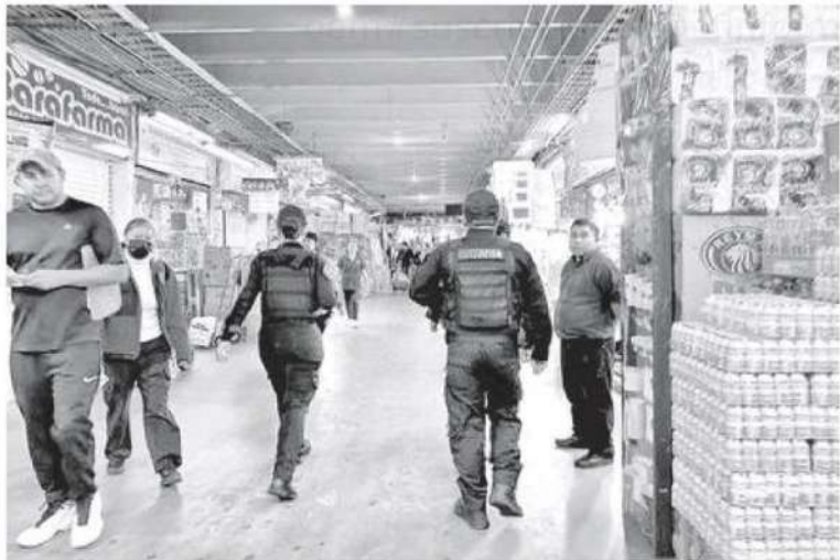
También se ha estipulado un operativo especial de vialidad y vigilancia ante el incremento que se espera de visitantes

También la Coordinación General de Seguridad, Vialidad y Protección Civil, pone a disposición de toda la comunidad y visitantes el teléfono 55-56-94-62-36, para denunciar cualquier irregularidad, delito o dudas.