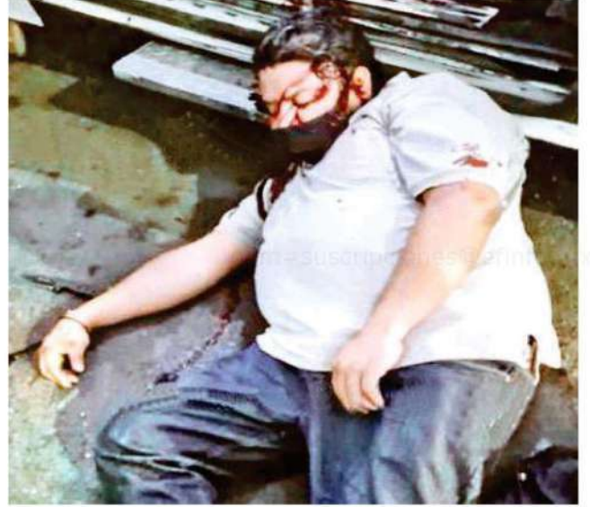
Cuando el presunto ladrón detectó al policía trató de escapar al tiempo que enfrentó al uniformado. Al repeler la agresión el elemento, disparó al presunto ladrón y logró abatirlo