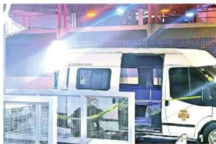
El uniformado abatió al delincuente

El delincuente detenido cuenta con dos ingresos al Sistema Penitenciario de la Ciudad de México por el delito de Robo calificado en el año 2006 y por el delito de Robo agravado en el 2021.