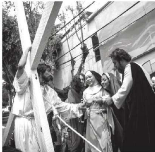
Para Viacrucis, se desplegará 6 mil policías

Pie de foto: En el 'Viacrucis' de Iztapalapa se desplegará 6 mil policías