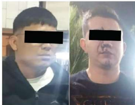
Les cayó la chota

El detenido de 26 años cuenta con un ingreso al Sistema Penitenciario de la Ciudad de México por el delito de Robo calificado en el 2023.