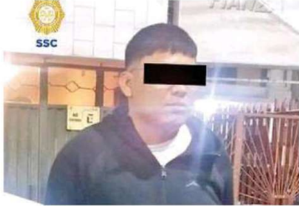
Los dos hombres fueron detenidos, se les leyeron sus derechos constitucionales y fueron puestos a disposición del agente del MP correspondiente