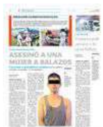
- Lo atraparon minutos después