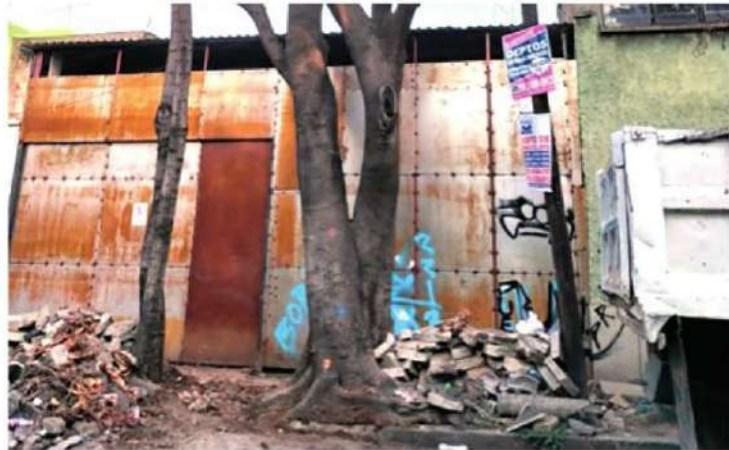
· En las inmediaciones del predio, se han talado árboles

Pese a este ecocidio, el gobierno panista se ha deslindado de cualquier posibilidad de reforestación, ya que en los últimos años no se ha destinado recurso para la plantación de árboles.