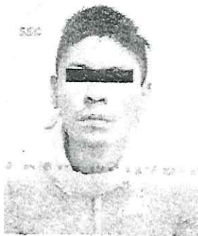
La agresión ocurrió en la colonia Campamento 2 de Octubre, alcaldía Iztacalco

En atención a la denuncia, los policías detuvieron a una persona de 29 años