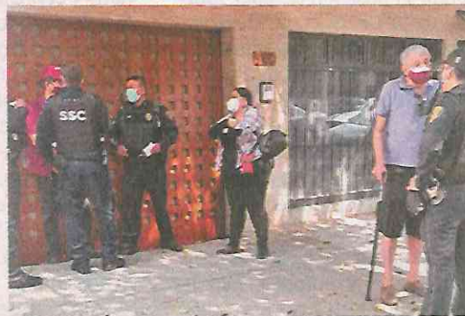
La víctima de 71 años increpó a los militantes de Morena por ser de ese partido.

De acuerdo con fuentes este es el tercer incidente que se registra de esta índole en la demarcación presuntamente con brigadistas de ese partido. ●