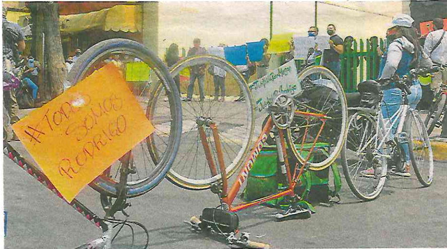
Los activistas lanzaron consignas a Claudia Sheinbaum y mostraron su apoyo a los padres del menor