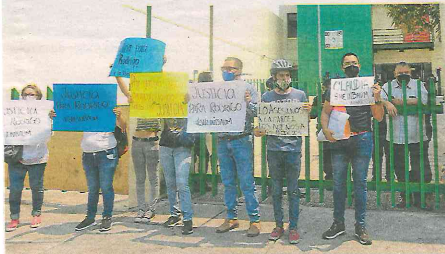
Una de las manifestantes dijo que por todos los accidentes exigen justicia y que no tienen garantías

Decenas de ciclistas bloquearon la calle Doctor Lavista, frente al TSJ, para exigir justicia y la sanción correspondiente