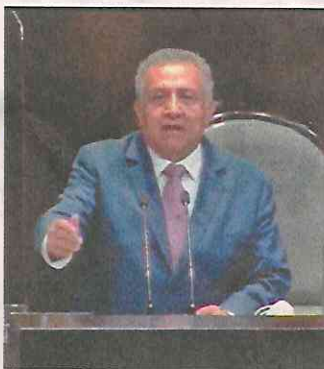
Benjamín Huerta, diputado federal de Morena.

“No debe haber impunidad bajo ningún motivo, en este ni en ningún caso, pero en particular en este no puede haber impunidad. (...) la fiscal que en todos los casos y en particular en este ha sido muy enfática, de que no importa si es diputado, si no es diputado, no importa qué carácter tenga en términos de servidor público, tiene que ser sancionada su actuación.