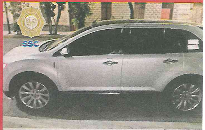
En una troca fueron detenidos los muchachos.