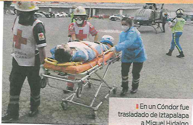
■ En un Cóndor fue trasladado de Iztapalapa a Miguel Hidalgo.

"Ahi, los oficiales de la SSC entregaron al paciente a una ambulancia de la Cruz Roja Mexicana, quienes lo trasladaron por tierra hasta el Hospital General Rubén Leñero ubicado en la Colonia Santo Tomás, en la Alcaldía Miguel Hidalgo, donde recibirá la atención médica especializada que requiere", informó la SSC.