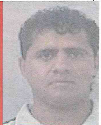
2017 El Ojos fue abatido por la marina en una de sus guaridas.

han sido detenidos los hijos menores del capo abatido por la Marina