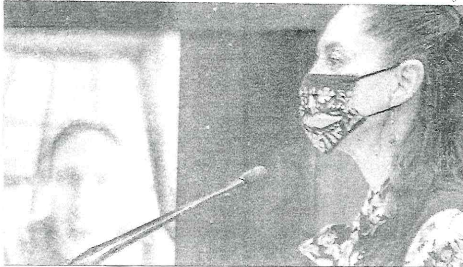
La jefa de Gobierno dijo enfática que no importa el cargo que ostenta, tiene que ser sancionado el legislador en caso de ser culpable.