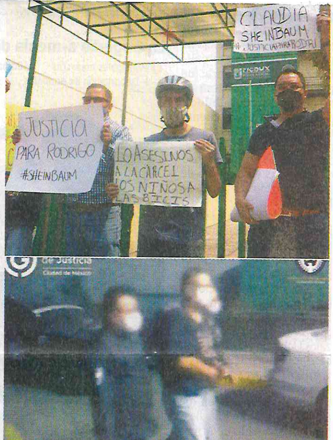
Arriba, familiares y amigos de la familia de Rodrigo demandando justicia. Sobre estas líneas, el acusado al momento de ser detenido.

Ayer, familiares y amigos de la familia de Rodrigo protestaron para exigir justicia por el asesinato del menor de edad.