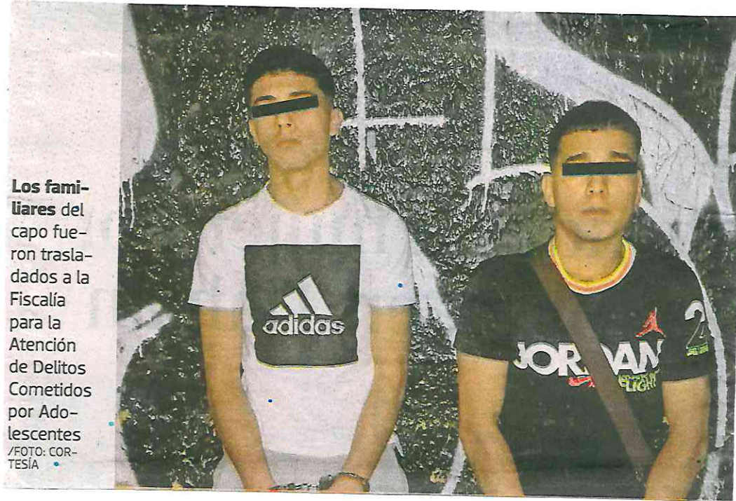
Los familiares del capo fueron trasladados a la Fiscalía para la Atención de Delitos Cometidos por Adolescentes