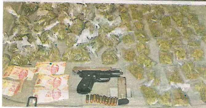
La policía les decomisó 100 bolsas con marihuana, un arma de fuego, 10 cartuchos útiles y dos básculas grameras