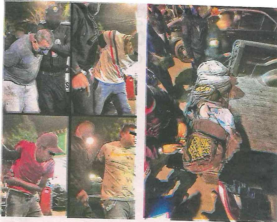
Se informó que los implicados posiblemente pertenecen al grupo delictual "Los Macedos"