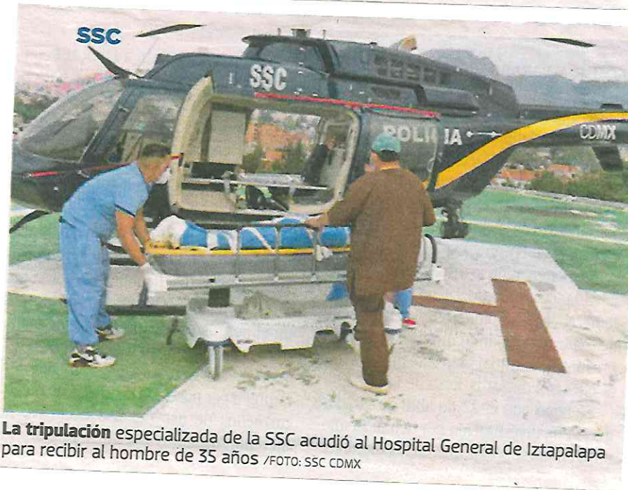
La tripulación especializada de la SSC acudió al Hospital General de Iztapalapa para recibir al hombre de 35 años

Ahí, los oficiales de la SSC entregaron al paciente a una ambulancia de la Cruz Roja Mexicana, que lo trasladó por tierra hasta el Hospital General Rubén Leñero, ubicado en la colonia Santo Tomás, alcaldía Miguel Hidalgo, donde recibirá atención especializada.