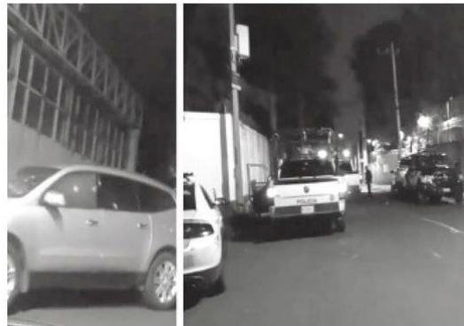
Le dispararon por la ventanilla

Autoridades recopilan pruebas y videos de las cámaras de vigilancia del lugar para rastrear a los asesinos.