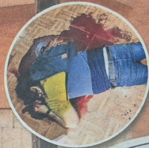
La víctima tenía heridas en el oído y la clavícula izquierda.